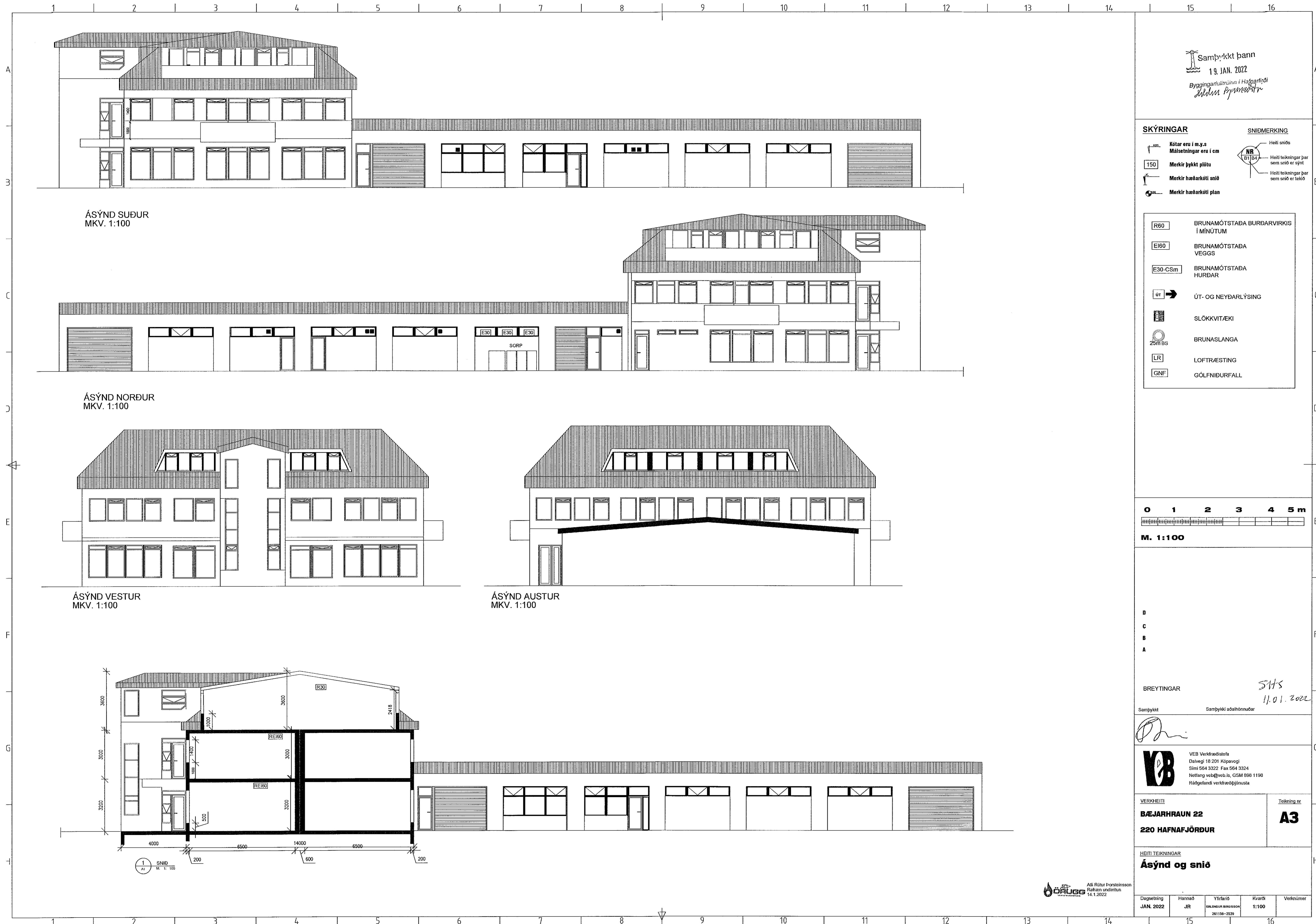
ÁSÝND SUÐUR MKV. 1:100