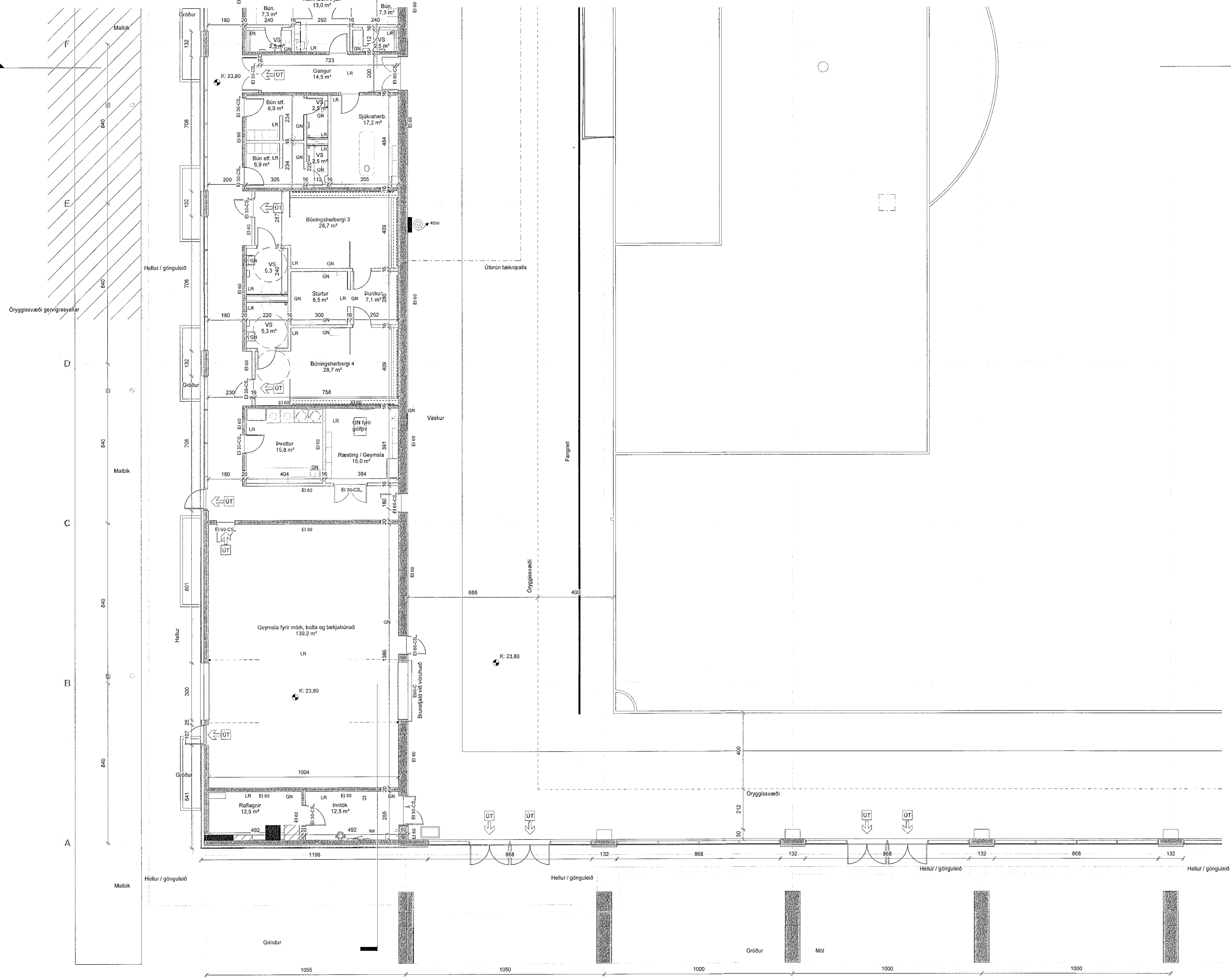
1. Hæð - Svæði 120 1 : 100

Sampykkt þann 25. JAN. 2023 Byggingarfulltrúi og Höfuðstjóri Hönnuð Bjarnadóttir