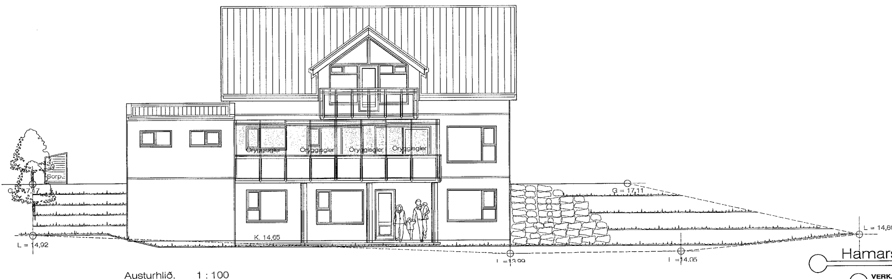
Austurhlíð. 1 : 100

Breytt 6.-3.-2023 Sett hlíðaropnandi svalalokun á svalir á 1. hæð hússins.