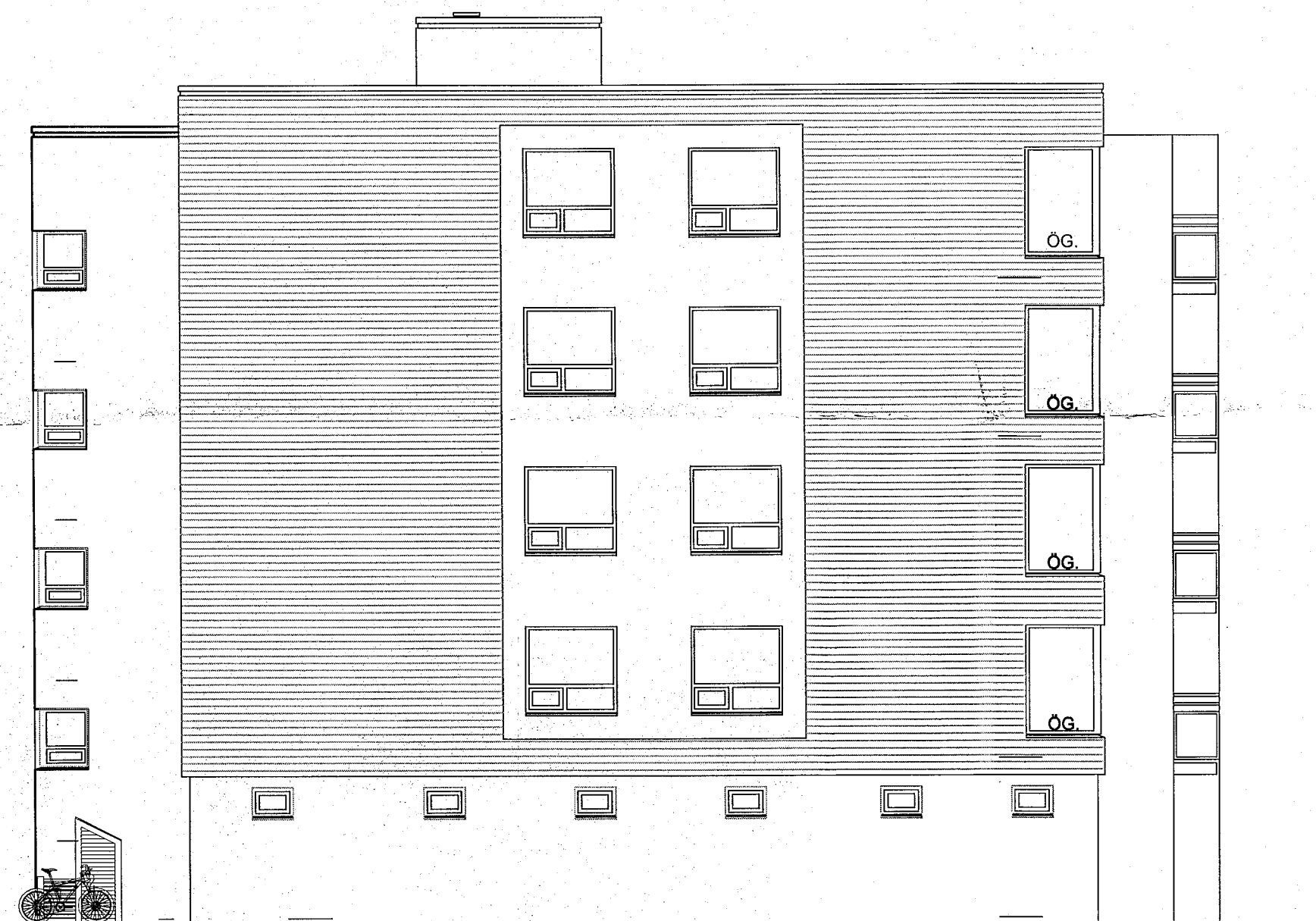
ÚTLIT SUÐ-VESTUR MKV. 1:100