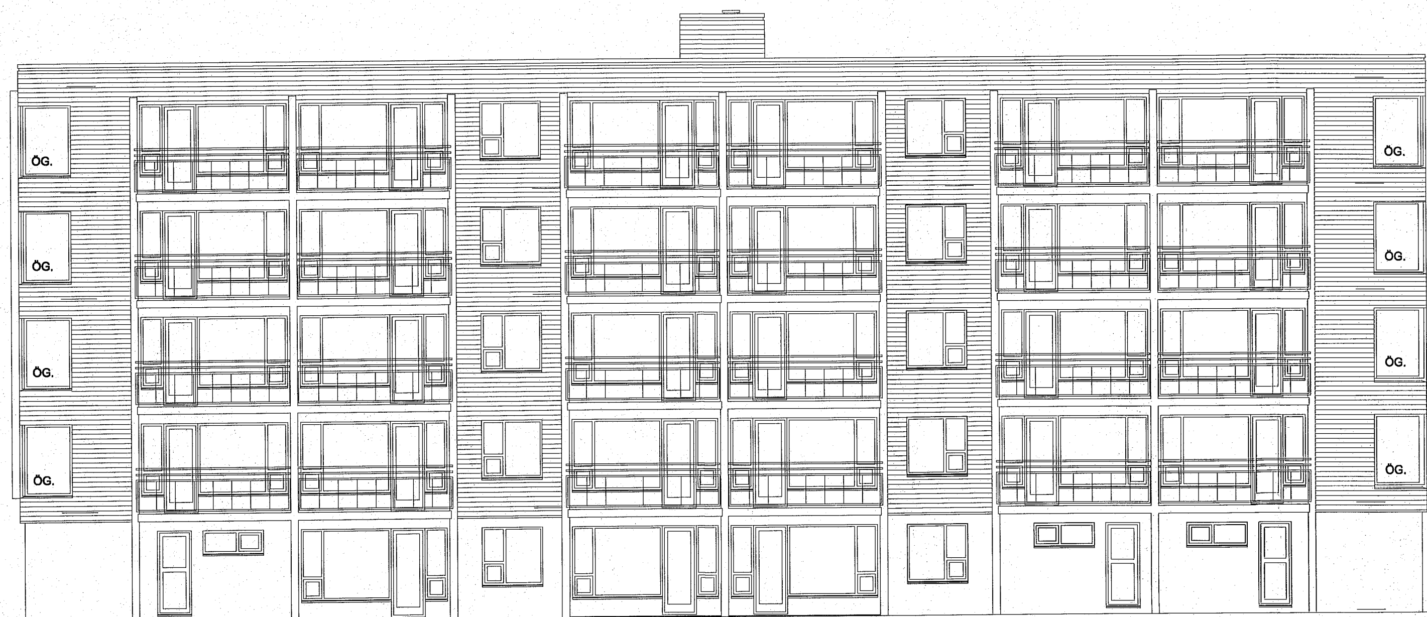
ÚTLIT SUÐ-AUSTUR MKV. 1:100