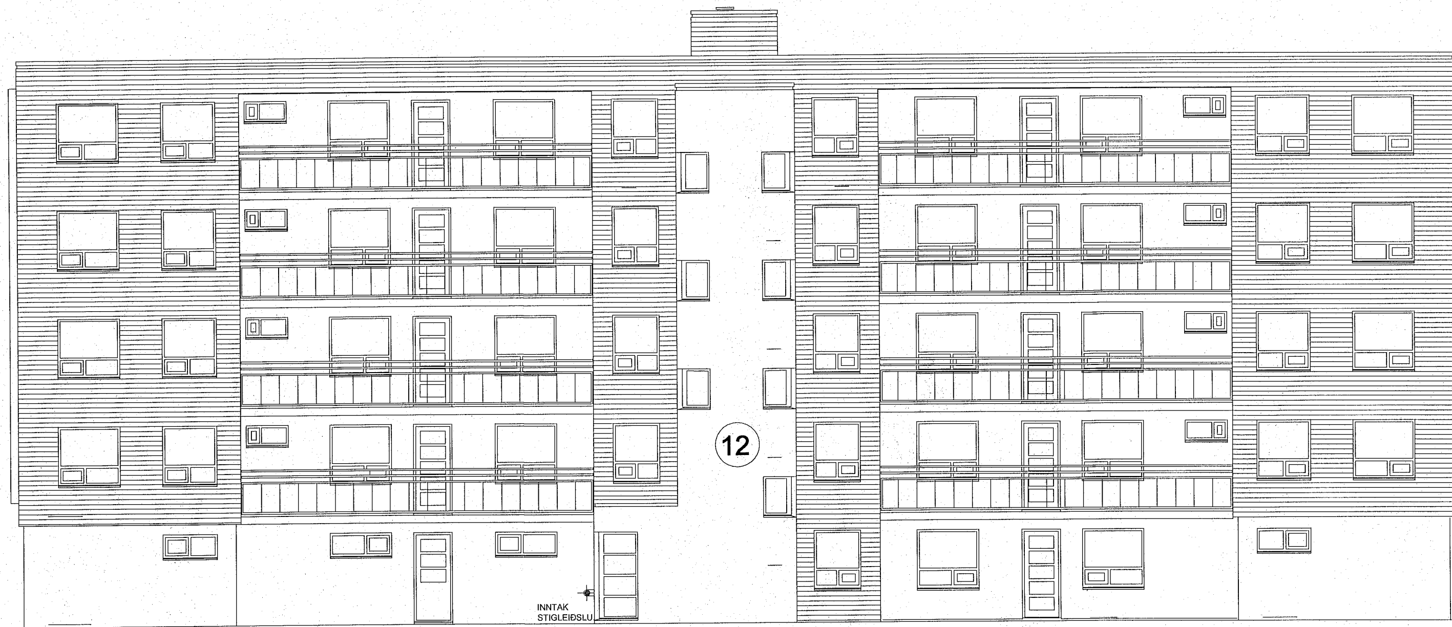
ÚTLIT NORÐ-VESTUR MKV. 1:100

Samþykkt þann 22. FEB. 2023 Byggingarfulltrúinn í Hafnarfirði Selma Þrymisdóttir