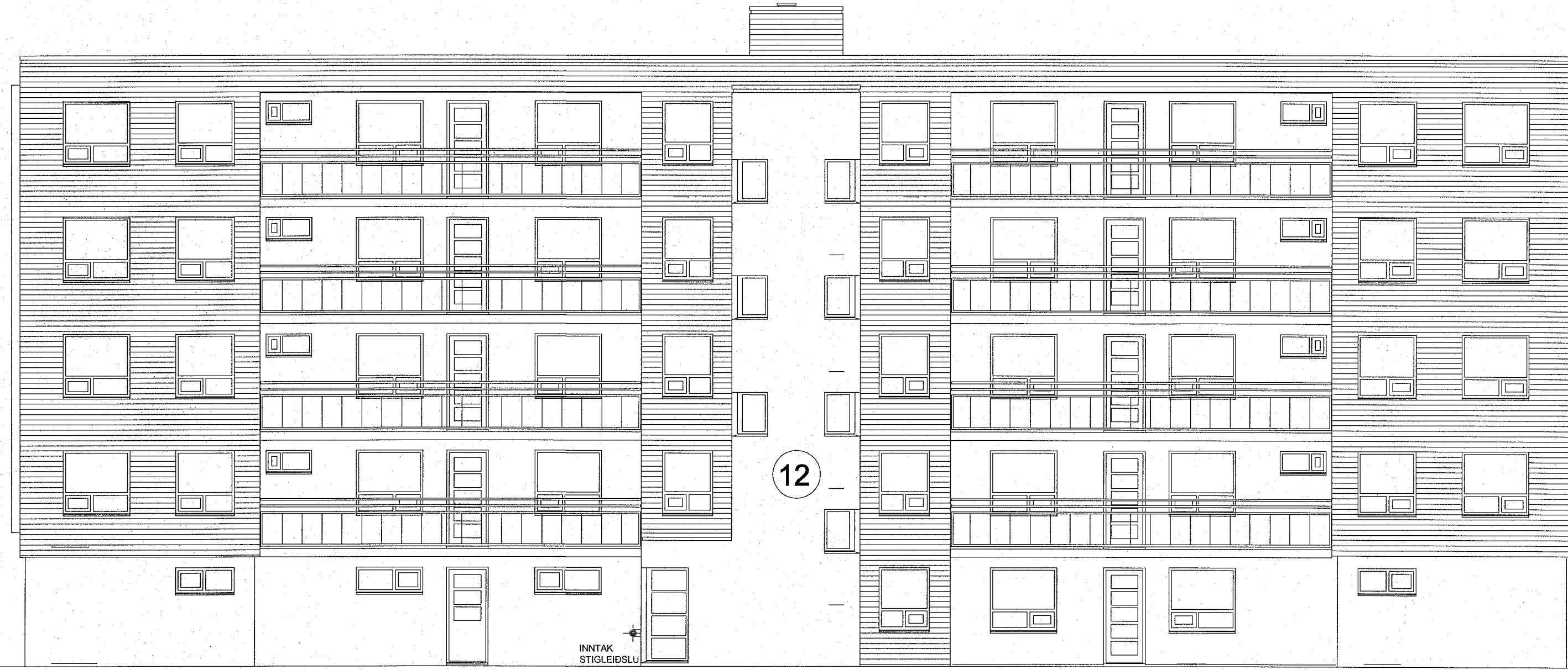
ÚTLIT NORÐ-VESTUR MKV. 1:100

Samþykkt þann 22. MAR. 2023 Byggingarfulltrúnaði í Hafnarfirði Sóluva Þorvaldur