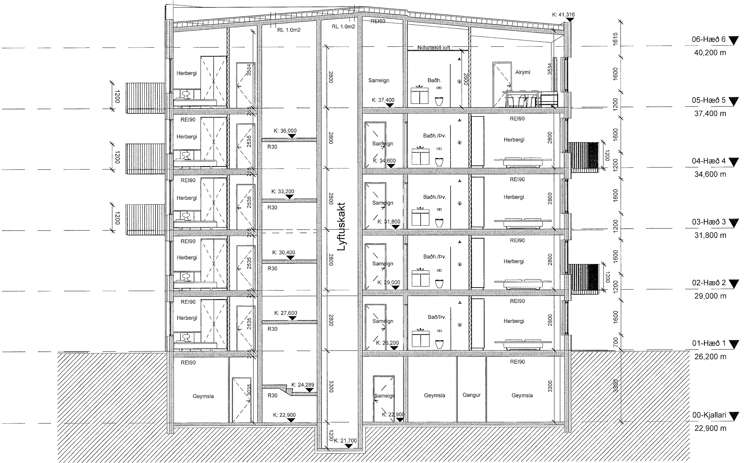
Sniðmynd BB mhl 01 1:100