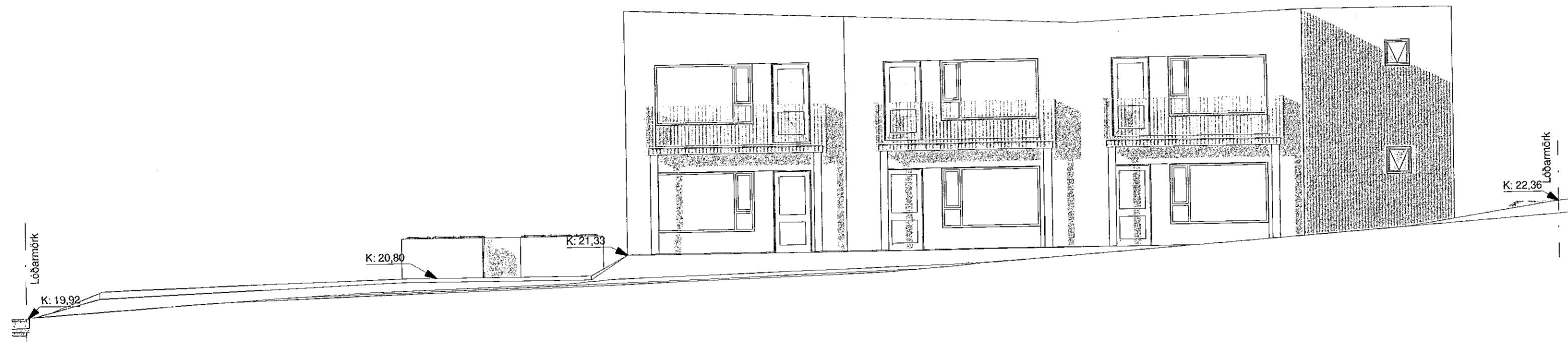
Útlit - suður 1 : 100

ÖLL MÁL OG AÐSTÆÐUR ATHUGIST Á STAÐNUM AÐUR EN SMÍÐI HEFST. ÓHEIMILT ER AÐ MÆLA UPP AF TEIKNINGUM. ASK ARKITEKTUM SKAL TILKYNNT UM ÓSAMRÆMI OG VAFAATRÍÐI ER UPP KUNNA AÐ KOMA.