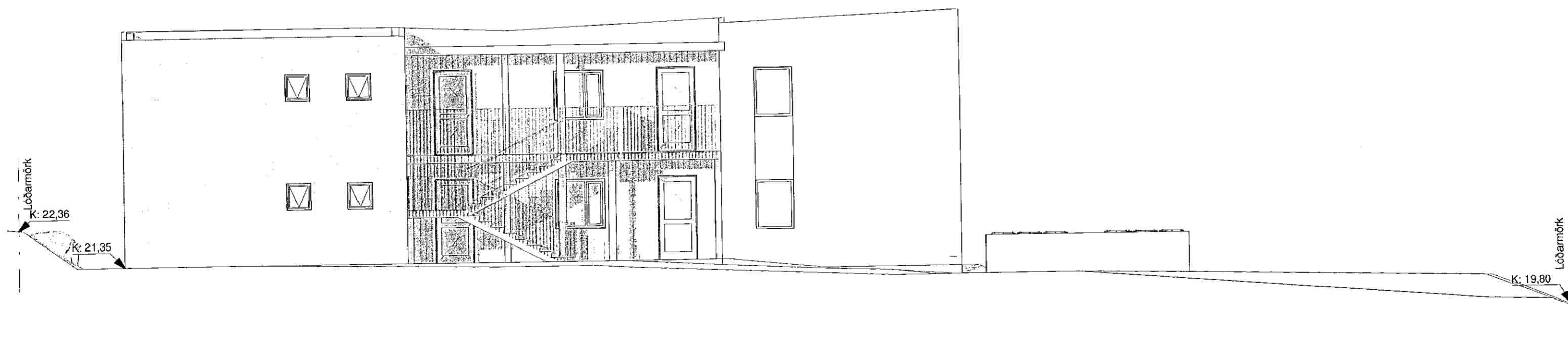
Útlit - norður 1 : 100