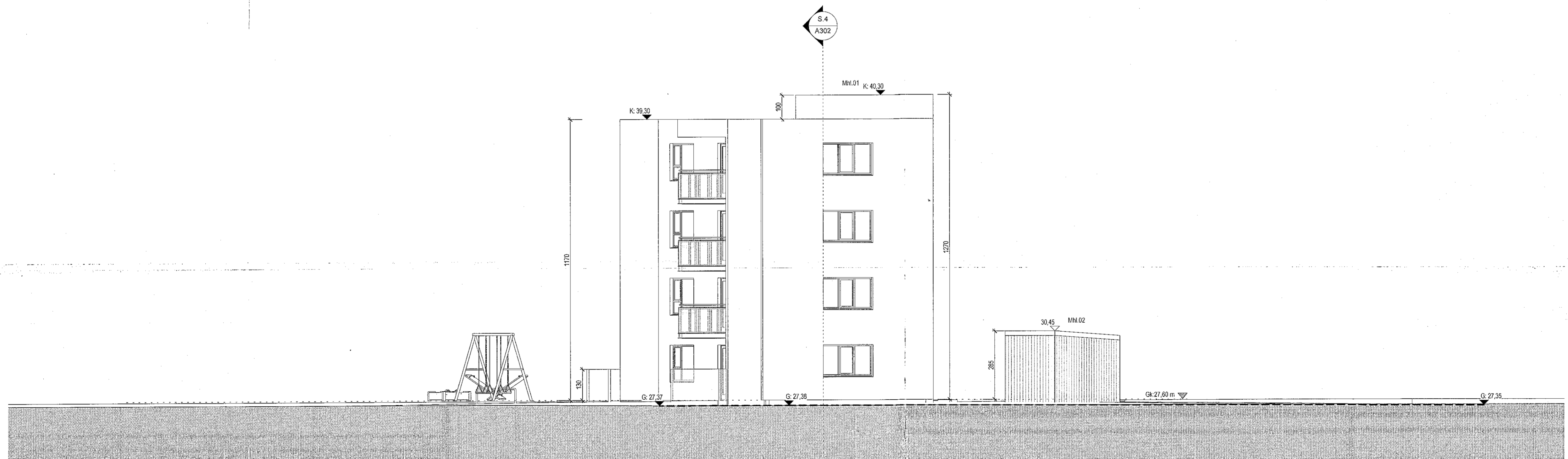
Norður útlit 1: 100