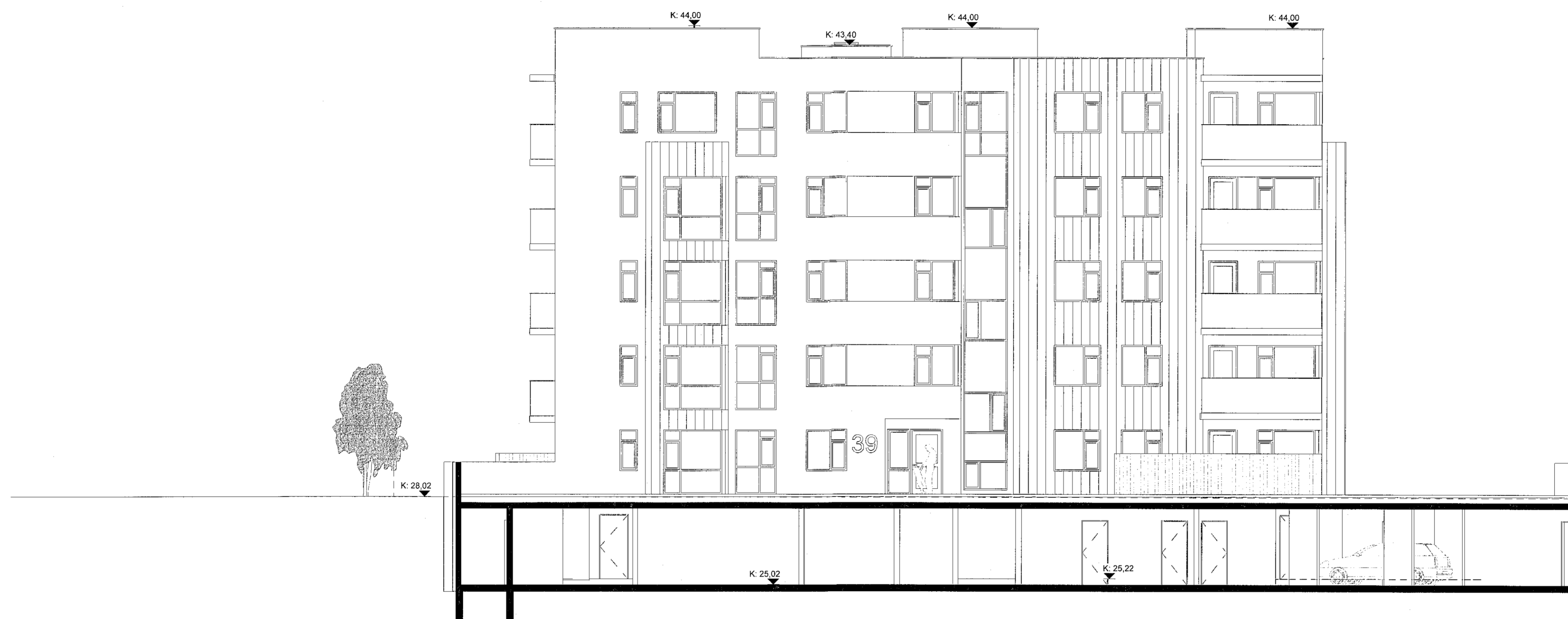
Norður 1 : 100