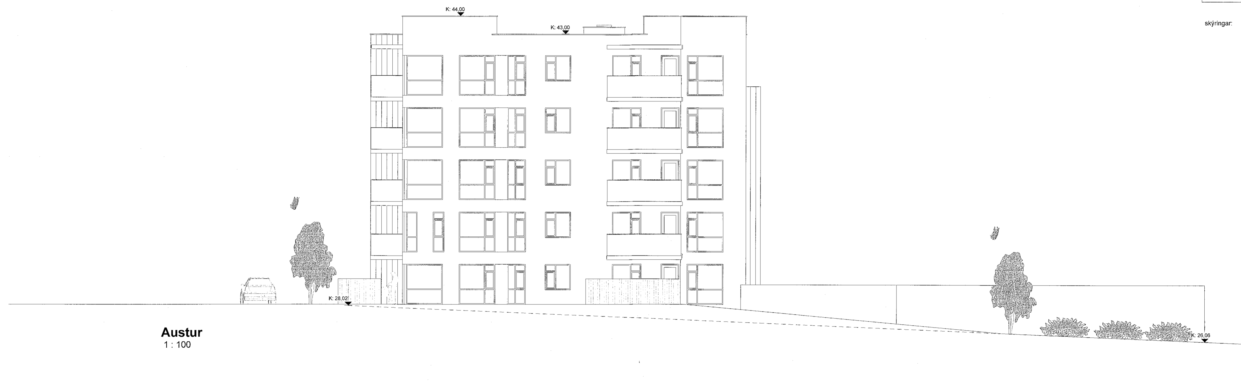
Austur 1 : 100