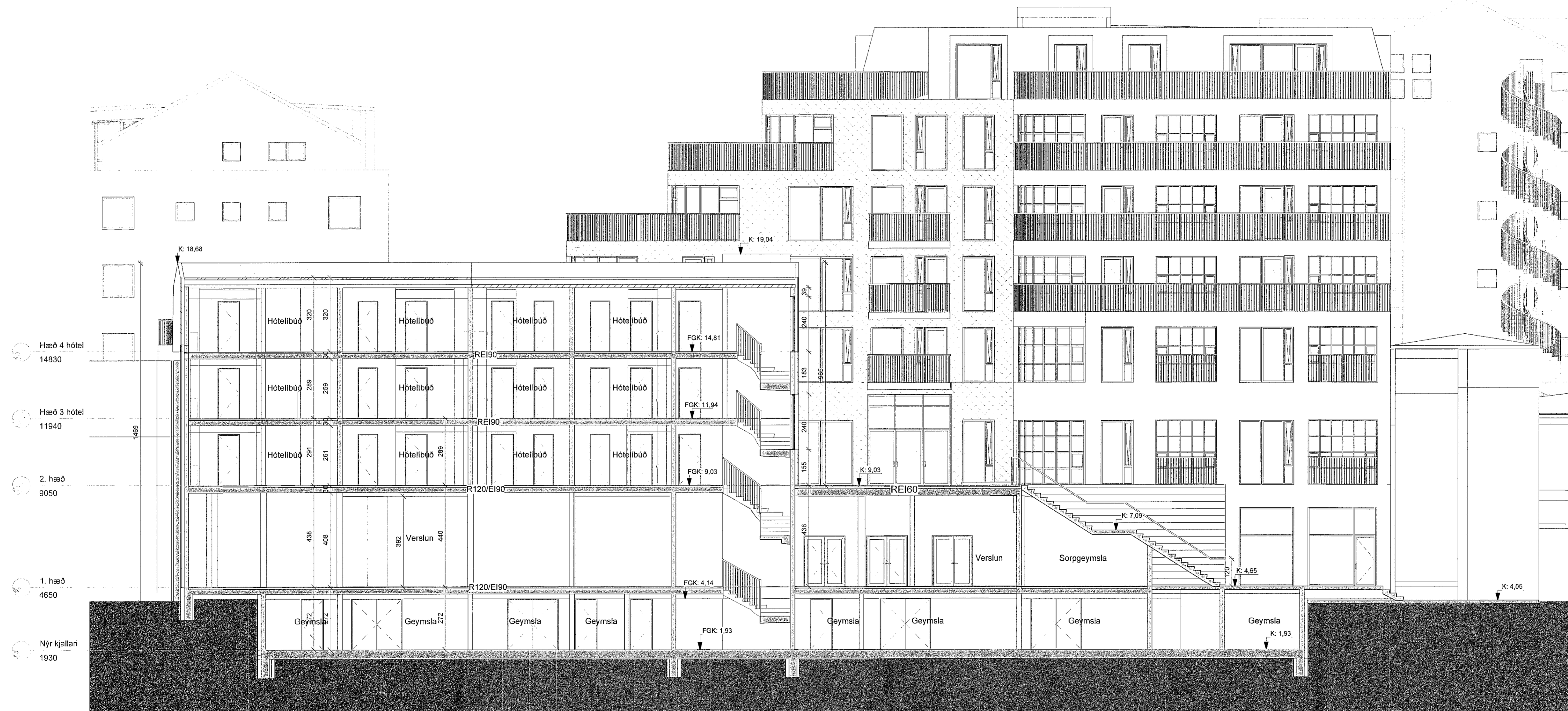
Sneiðing C-C 1 : 100

Upprunalegur hönnuður verunarmáttölóvarinnar er Erling G. Pedersen