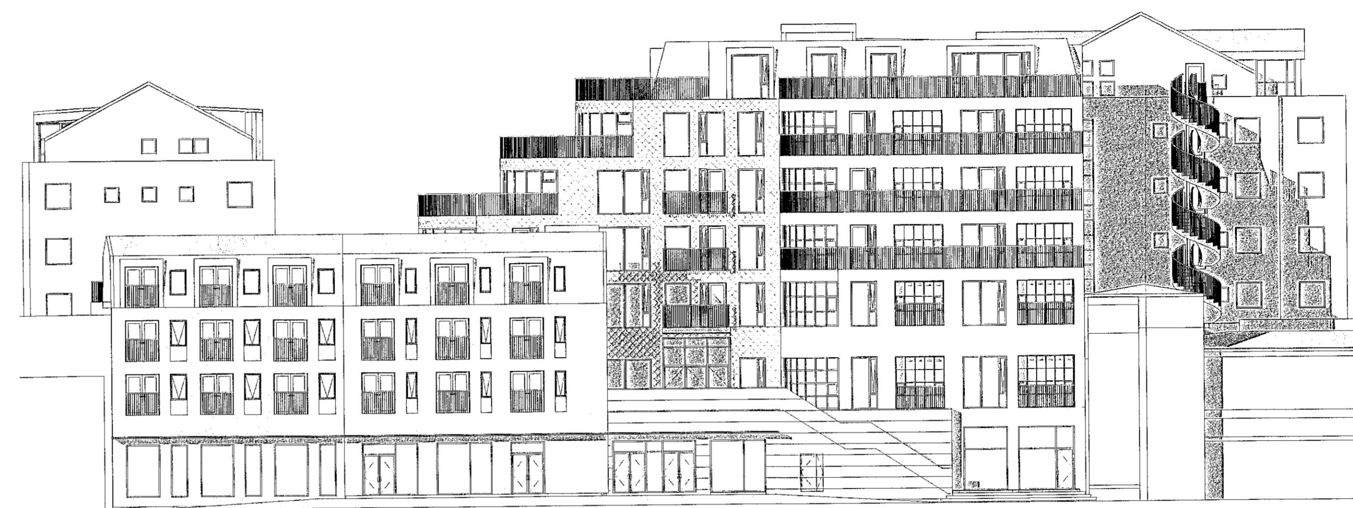
Útlit - Austur 1 : 200