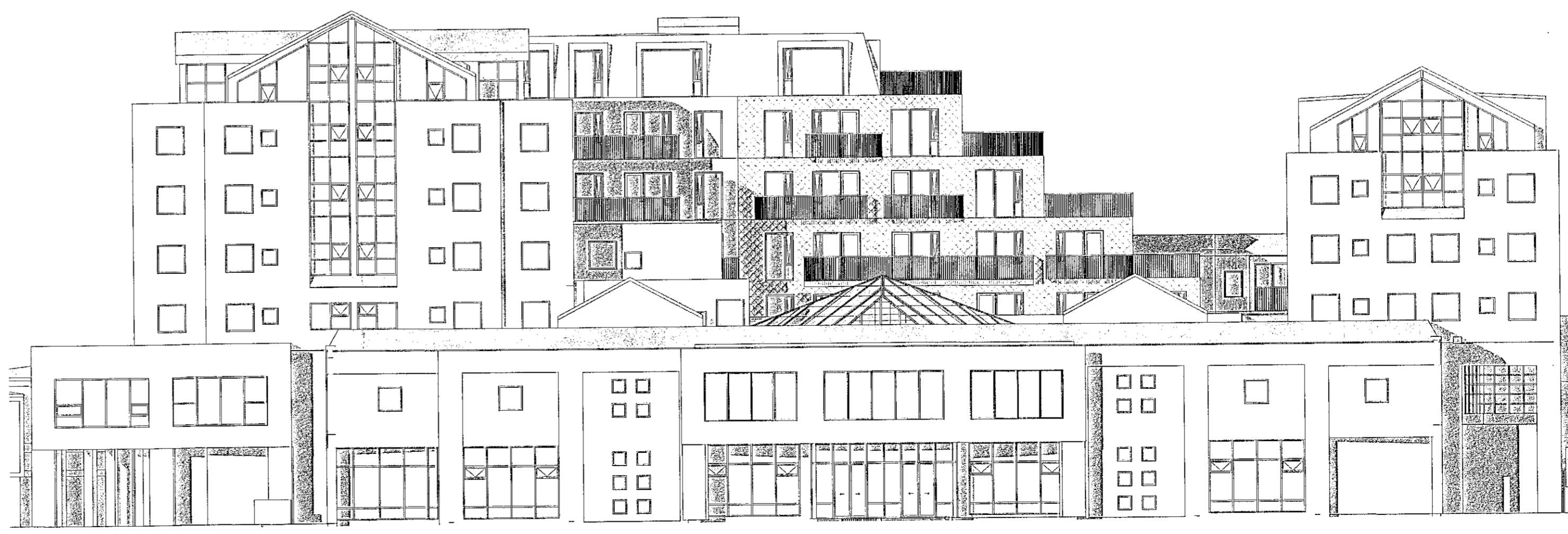
Útlit - Vestur 1 : 200

Samþykkt þann 28. SEP. 2022 Byggingarfulltrúinn í Hagkerfi Mólan Ágústsson