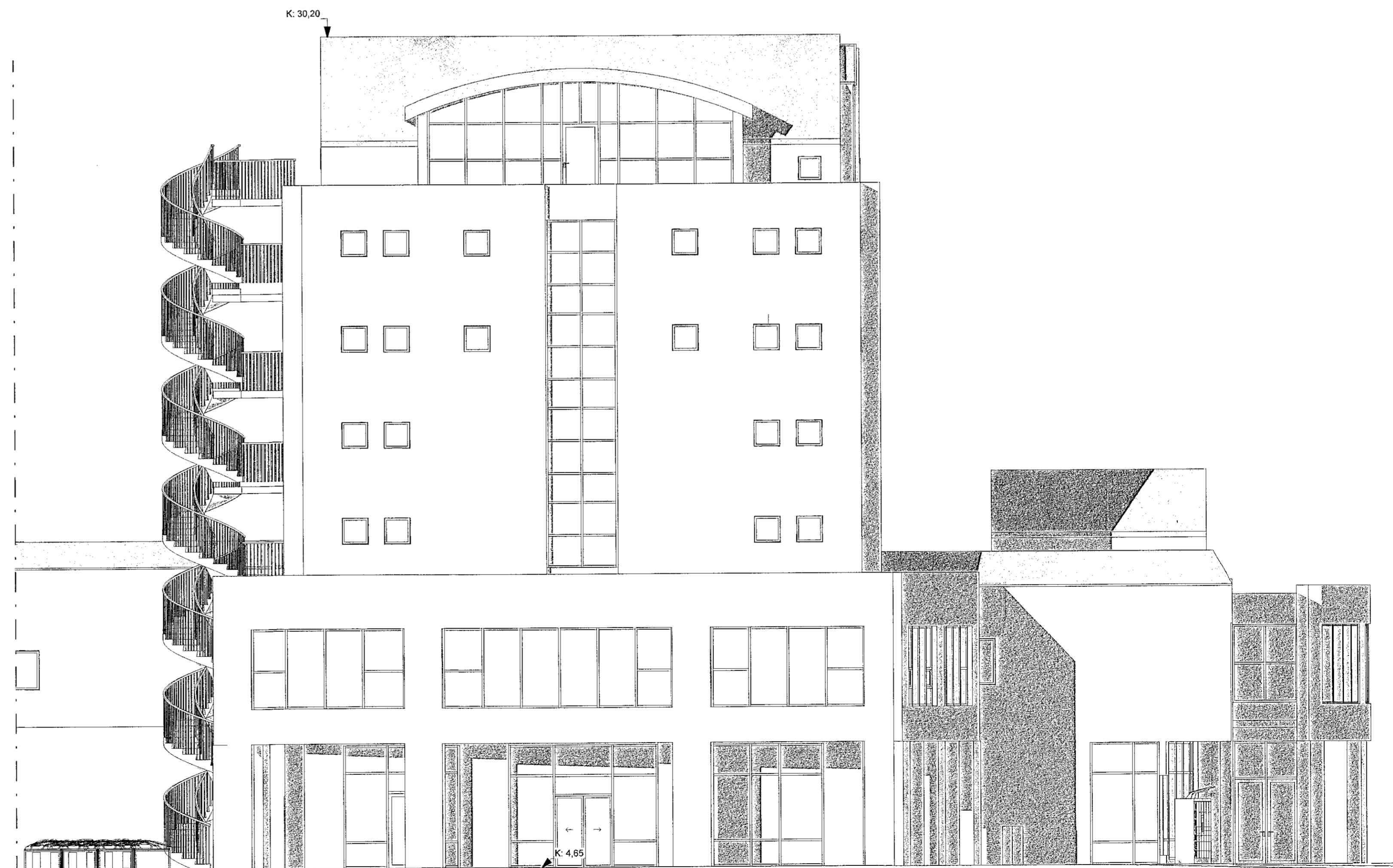
Útlit - Norður 1 : 100

Samþykkt þann 28. SEP. 2022 Byggingartulltrúinn í Hafnarfirði Selma Þýmasdóttir