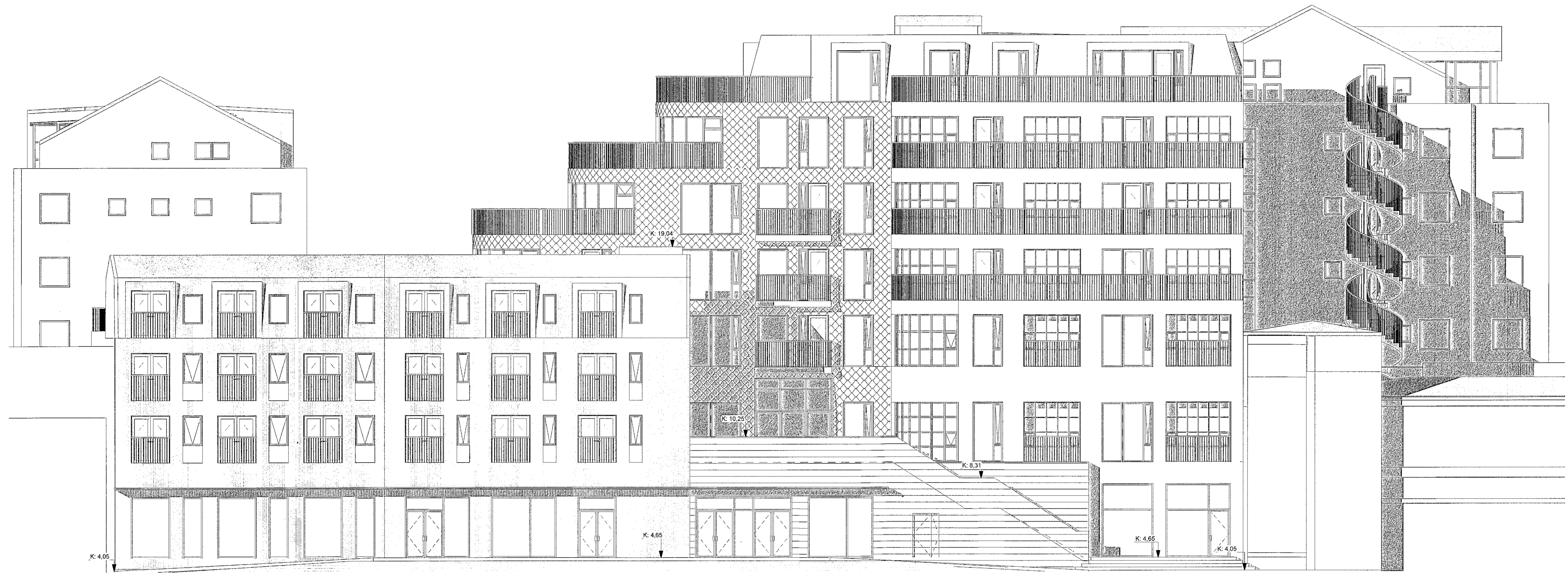
Útlit - Austur 1 : 100

Upprunalegur hönnuður verustunarmiðstöðvarinnar er Erling G. Pedersen