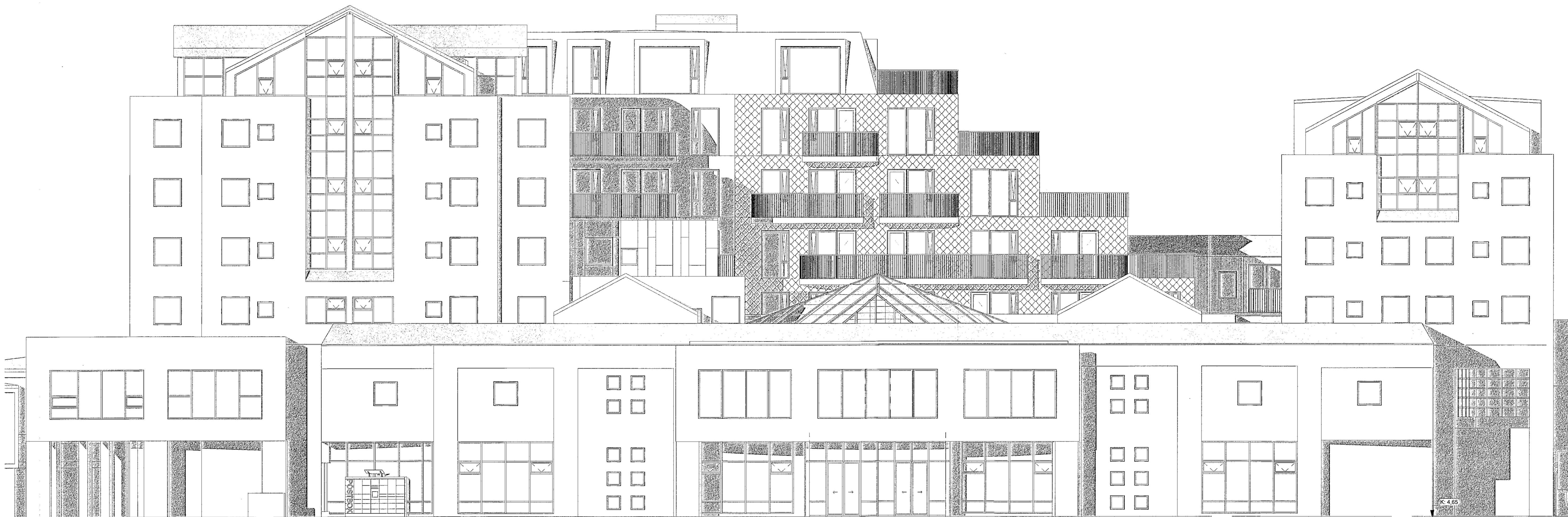
Útlit - Vestur 1 : 100

Upprunalegur hönnuður versunarmiðstöðvarinnar er Erling G. Pedersen