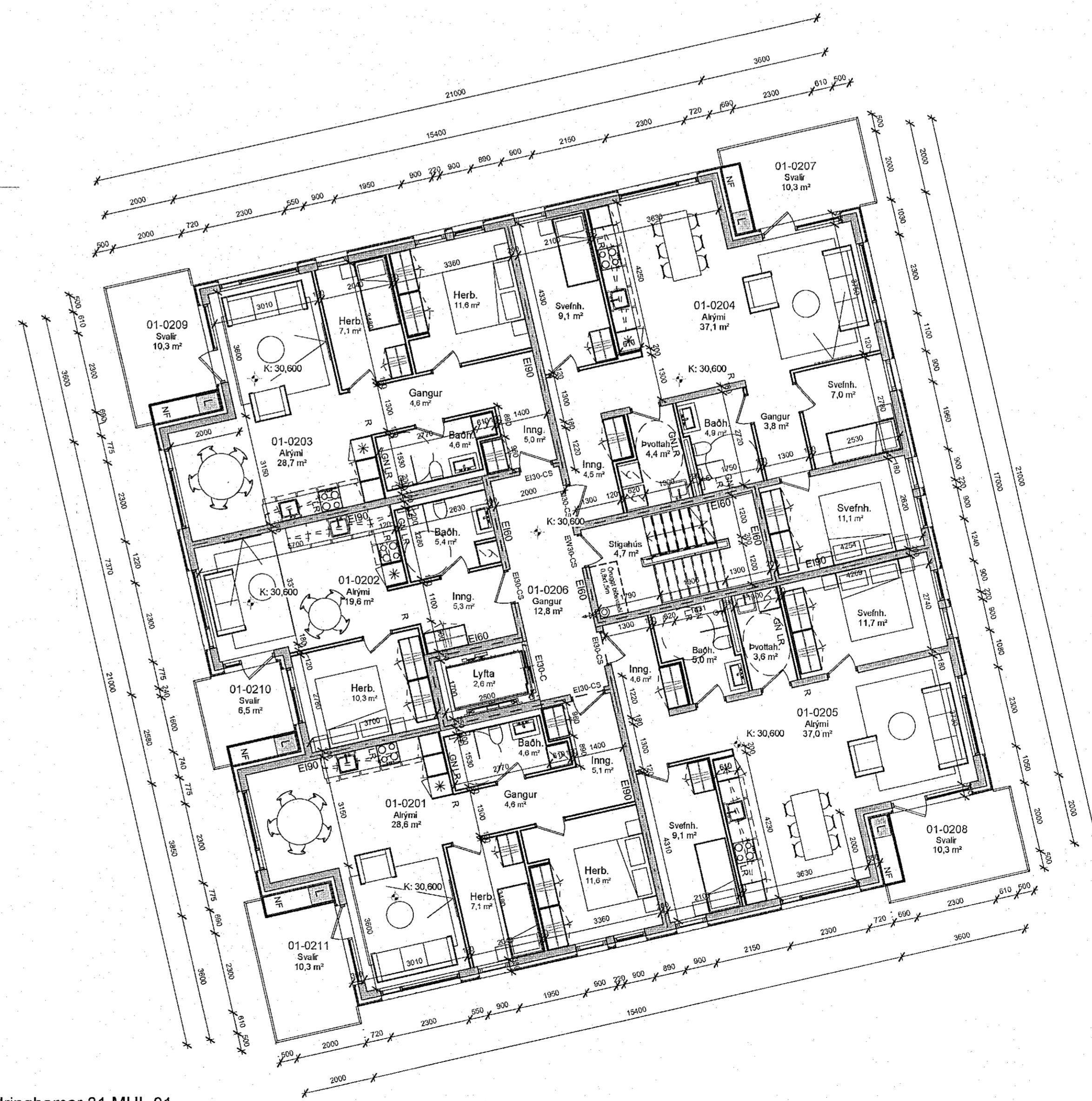
Hringhamar 31 MHL 01