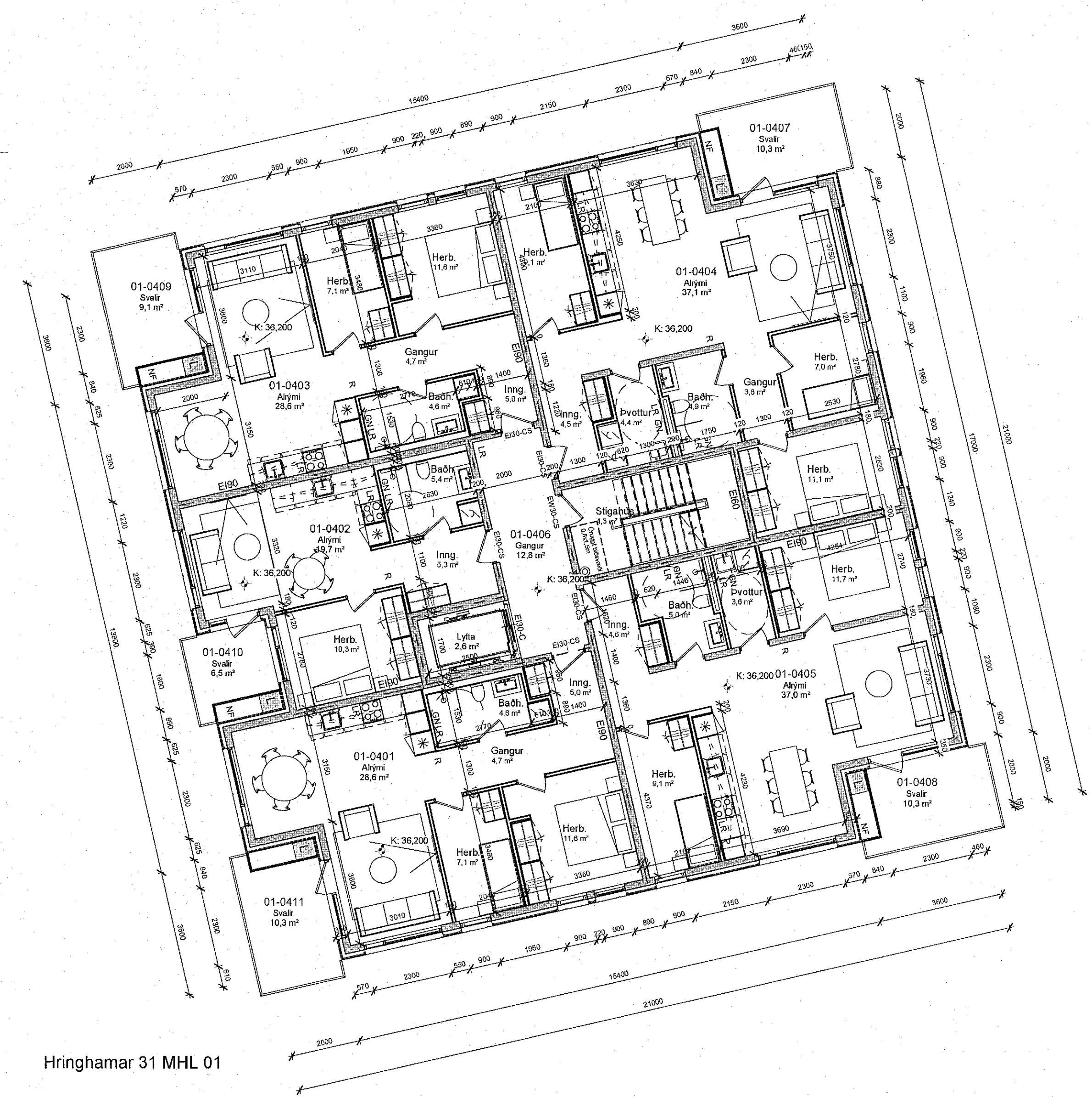
Hringhamar 31 MHL 01