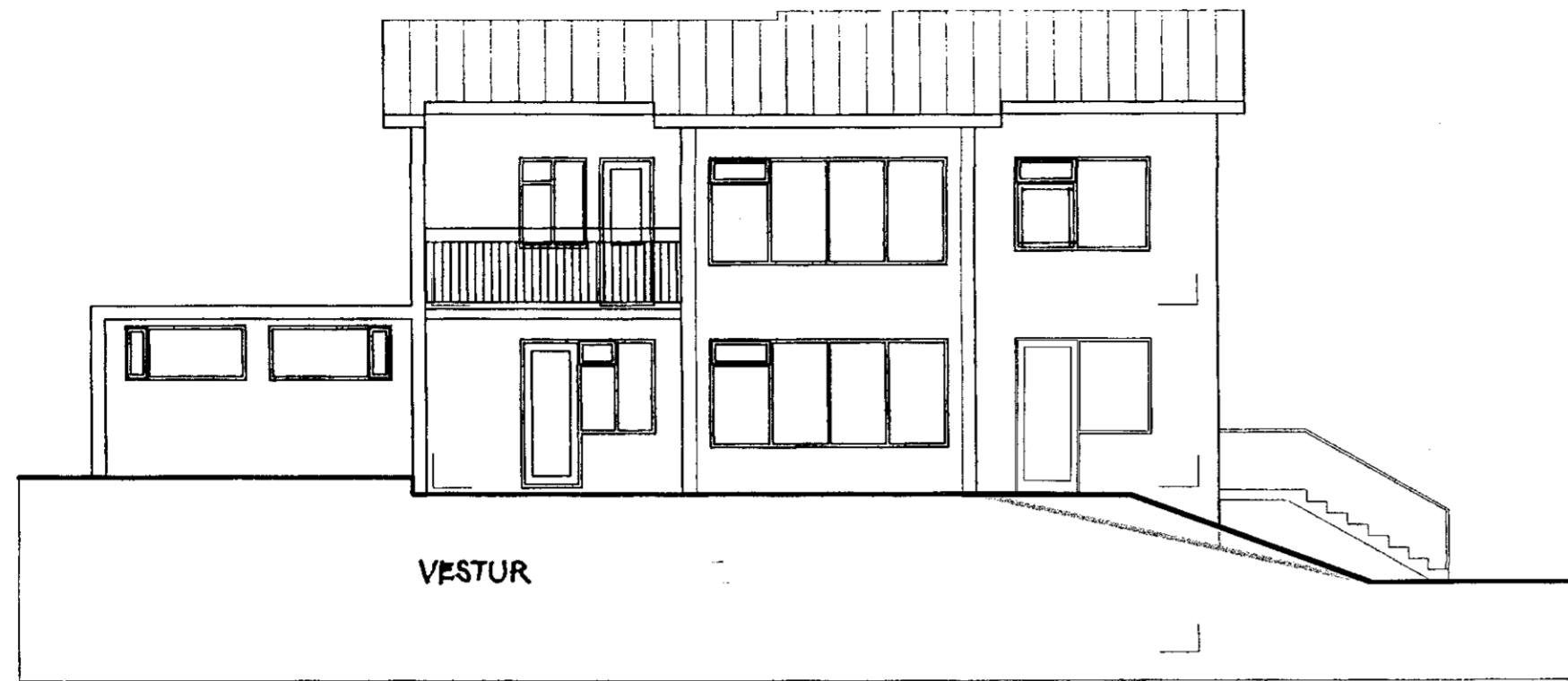
Útlit: Vestur 1:100