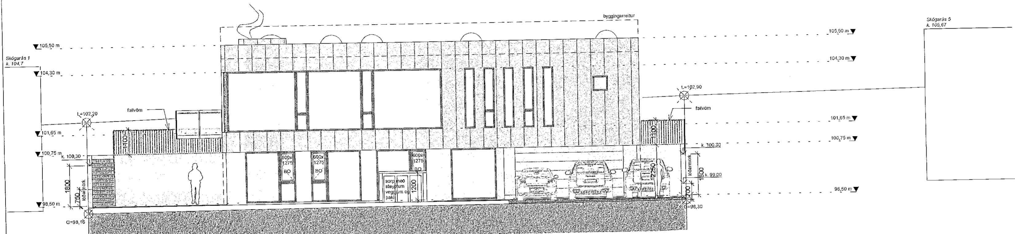
ÚTLIT AUSTUR - að götu 1 : 100