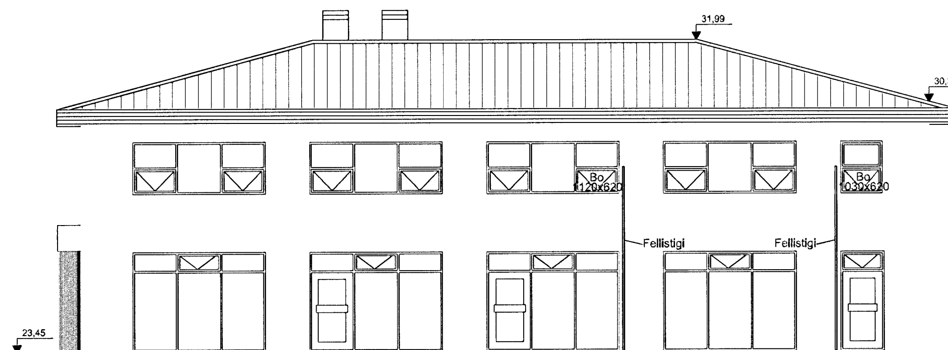
ÚTLIT AUSTUR MKV 1:100

HÚSFÉLAGIÐ TRÖNUHRAUNI 1 VERKKAUPTI / EIGANDI SKRIFSTOFU- OG VERSLUNARHÚSNÆÐI TEGJUND VERKS