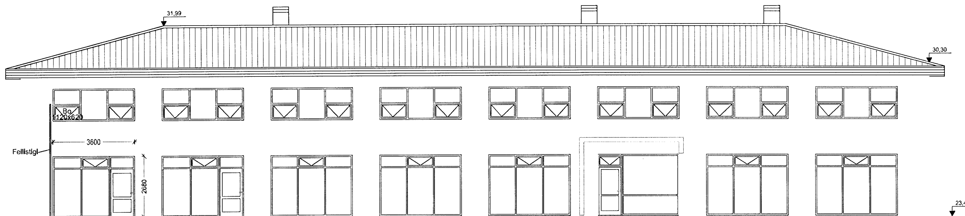
ÚTLIT SUÐUR MKV 1:100