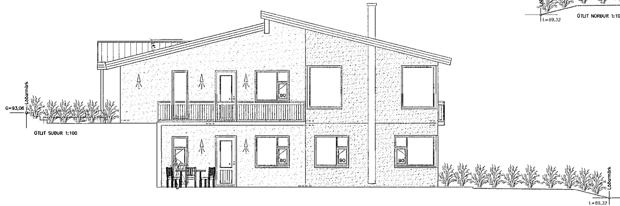
ÓTLIT SUÐUR 1:100

3* = Útliti breytt í samræmi við tillögu af stækkun og breyttu innraskipulagi. 2* = glugga í eldhúsi speglað. 1* = gluggum í stofu, eldhúsi og sjónvarpshóli á 1.h. eru hækkaðir frá gólfi.