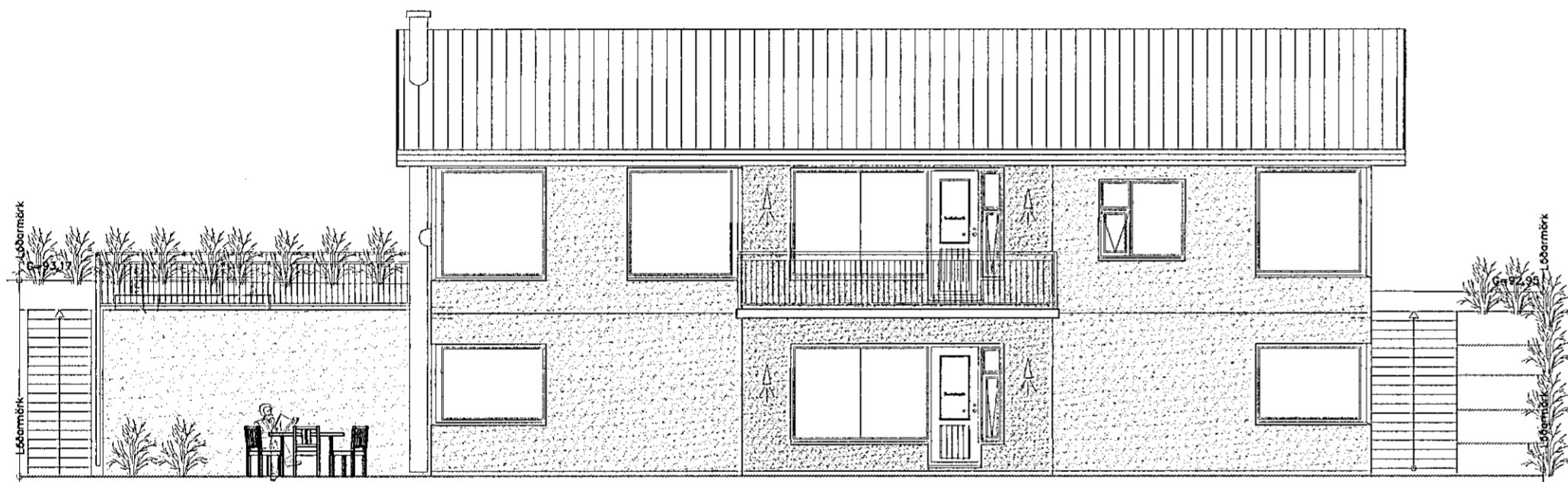
ÓTLIT AUSTUR 1:100