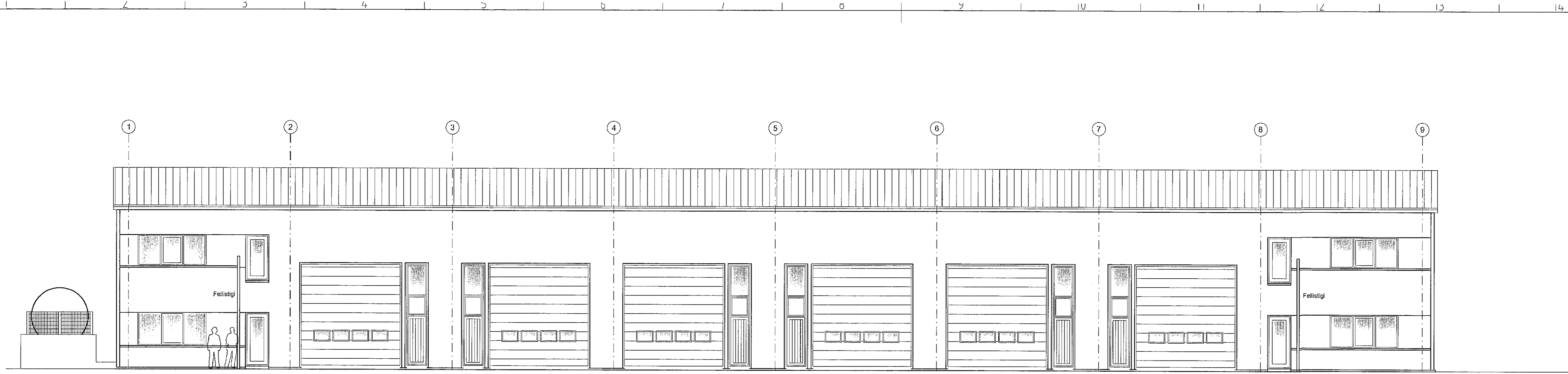
NORD - VESTUR MHL. 01