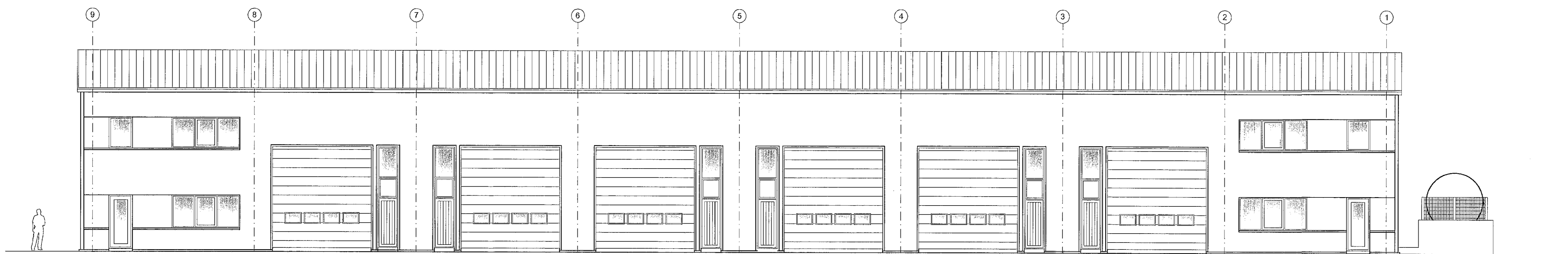
SUD - AUSTUR MHL. 01