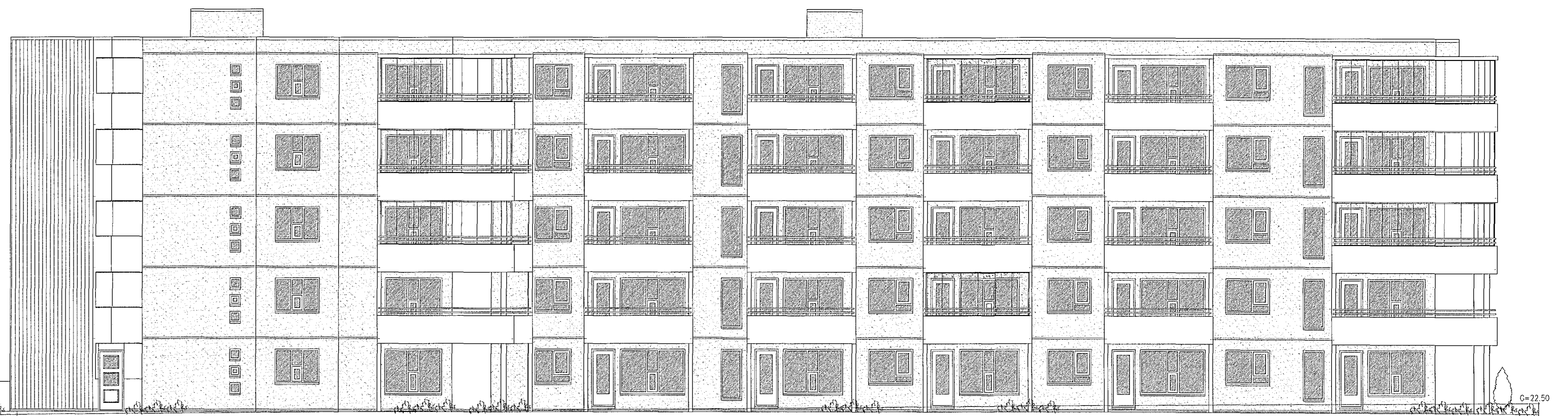
ÚTLIT VESTUR MKV. 1:100.

SVALASKÝLL Svalaskýli er lokað með 8-10 mm hertu gleri. Svalaskýli er lokað (B-LÖKUN) með glerningum sem hvíla í þar til gerðum álbrautum. Svalaskýlin eru opnanleg sbr. gráin 102 í byggingareglugerð. Niðurföll og yfirföll eru á svölum.