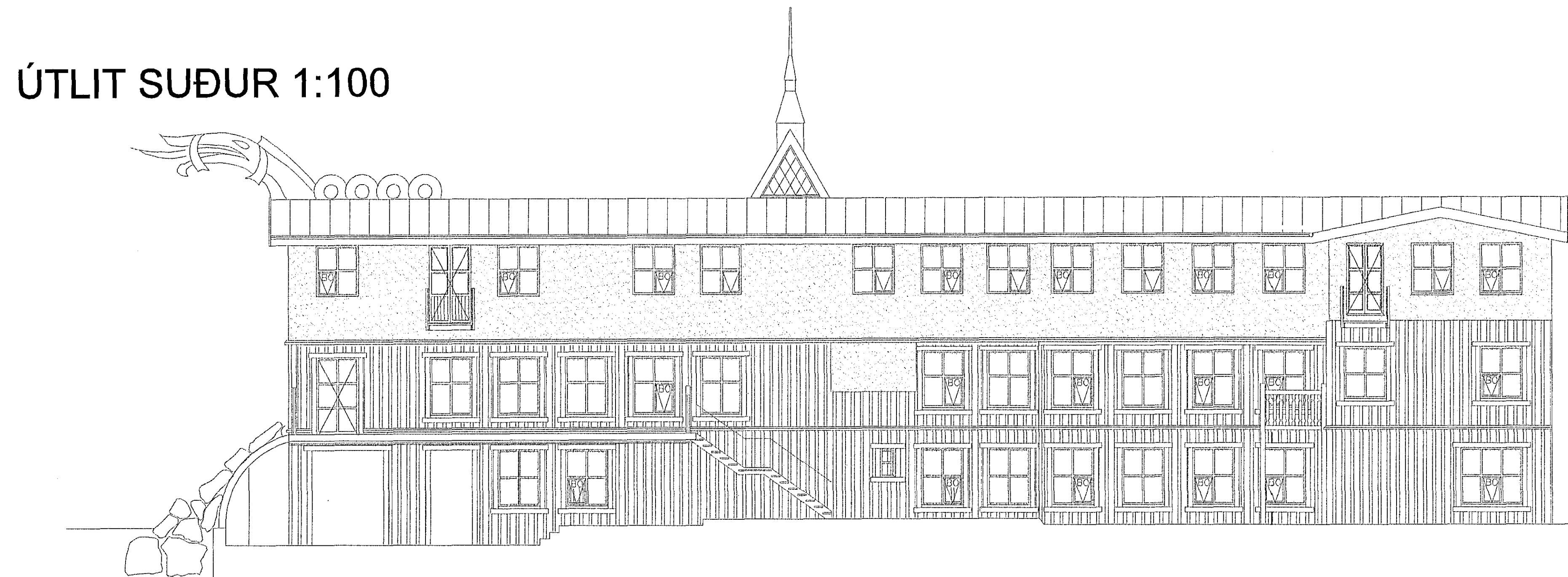
ÚTLIT SUÐUR 1:100

Breyting 22. nóvember 2012. Áður gerðar teikningar eru gerðar af teiknistofunni Úti og inni. Breyting á innra skipulagi gerðar af Erlendi Ána Hjálmarssyni og Alla Erlendssyni 1. hæð= í borgsal er breyting á bar og snyrtingum. Breyting 24. janúar 2013. Bætt við eldvamærkingum á hurðum og veggjum Breyting 12. febrúar 2015. Breytingar að innan, tilfærsla á veggjum og brunaslöngu