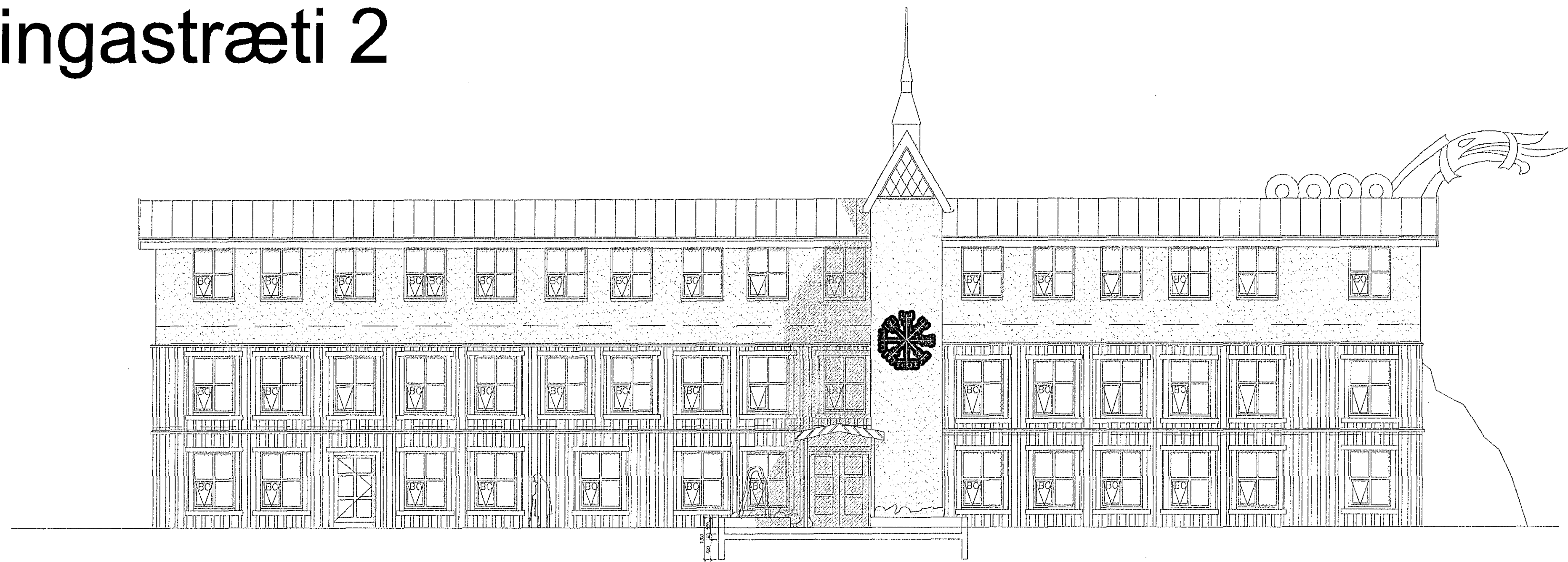
ÚTLIT NORDUR 1:100

Samþykkt þann 25 FEB 2015 Byggingafulltrúinn í HafnarF-ry F.h. Sigurður Steinar Jónsson