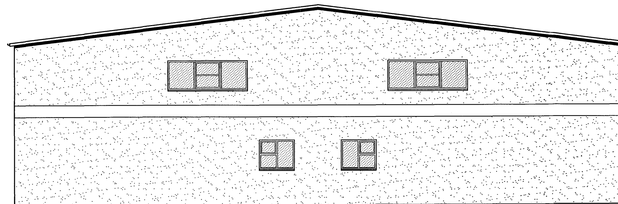
ÚTLIT AUSTUR OG VESTUR