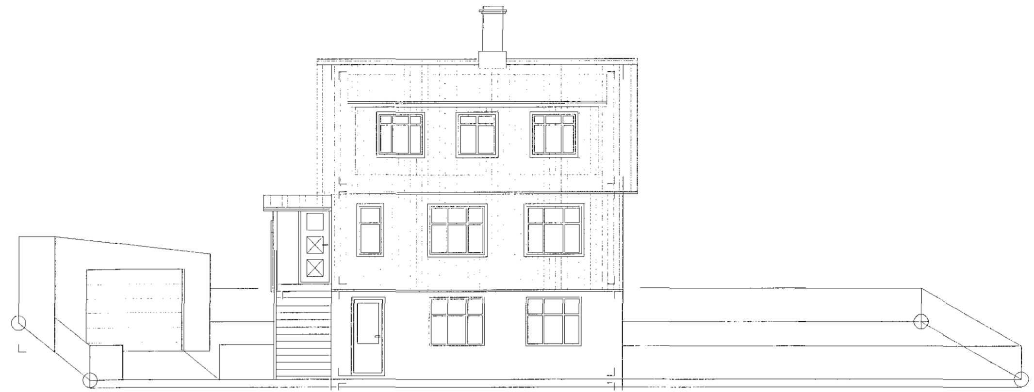
NORÐ-VESTUR (AÐ GÖTU)