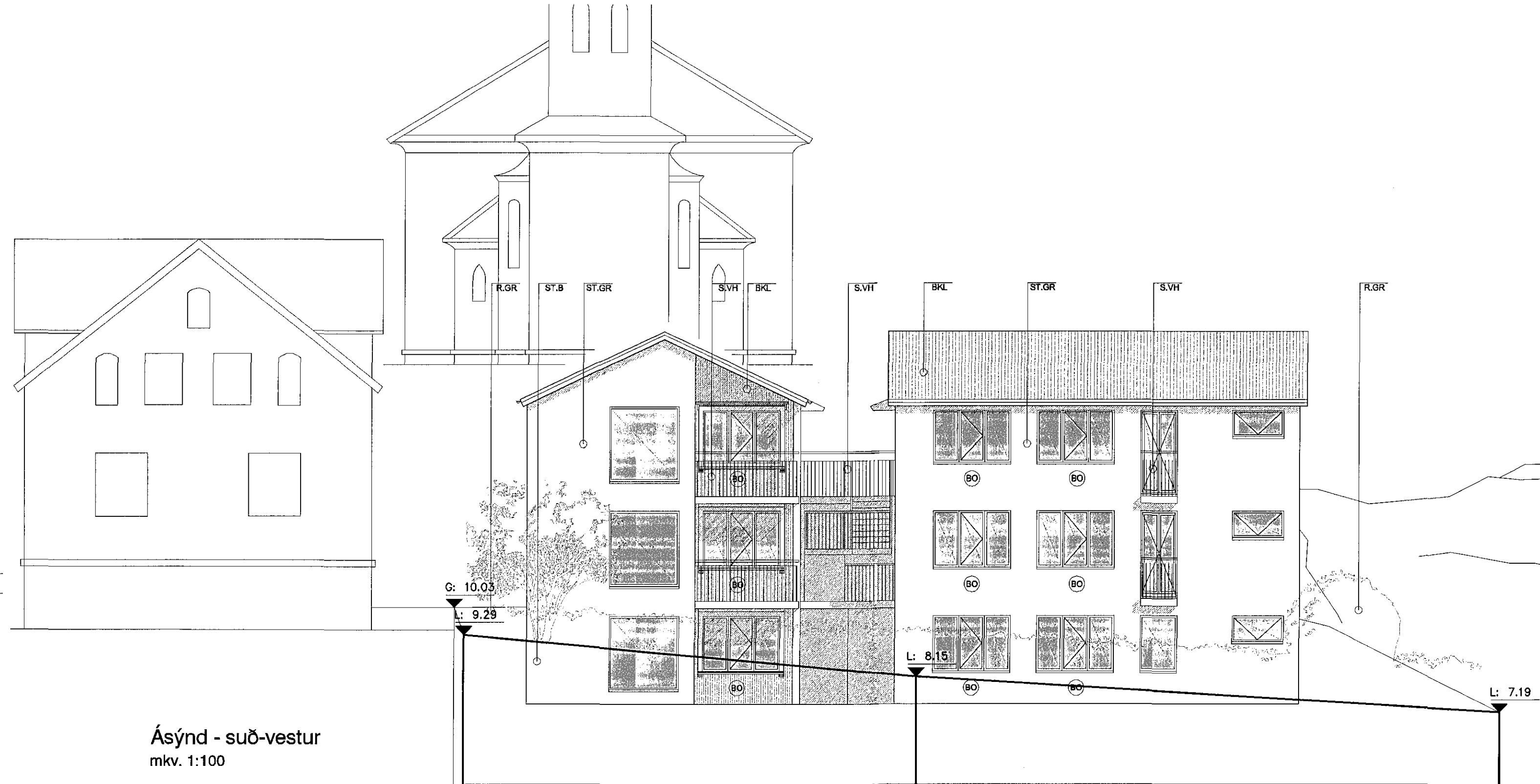
Ásýnd - suð-vestur mkv. 1:100