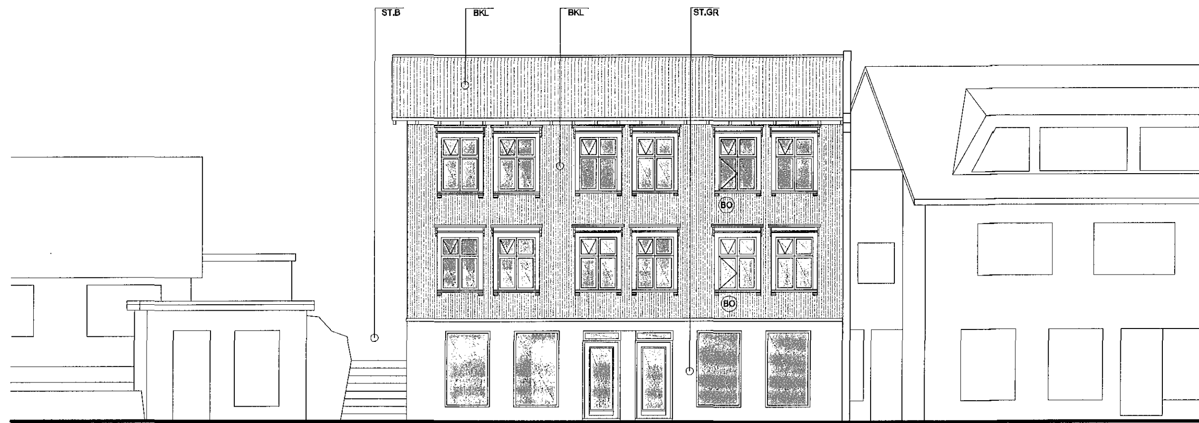
Ásýnd Suð-vestur mkv. 1:100