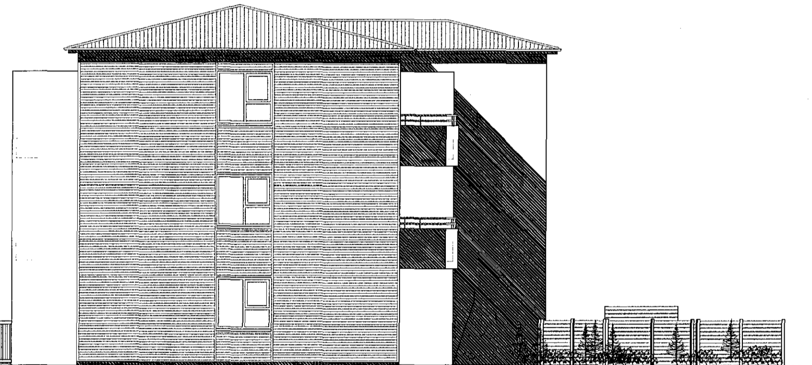
NORÐAUSTUR. MKV. 1:100.