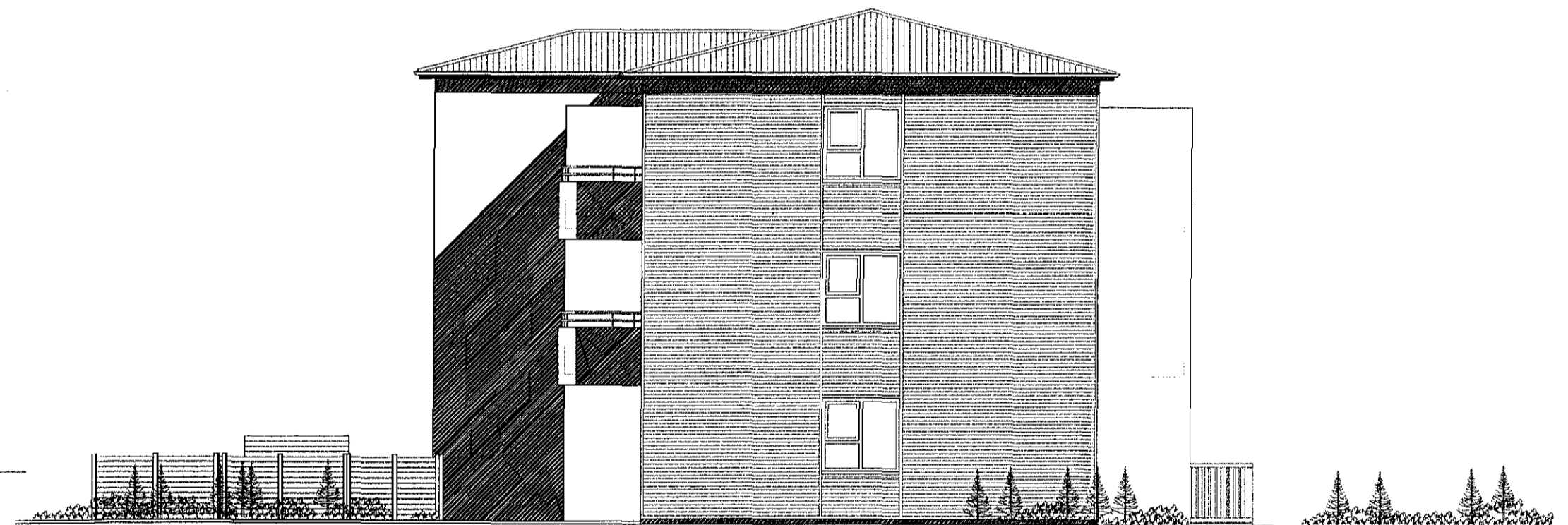
SUÐVESTUR. MKV. 1:100.