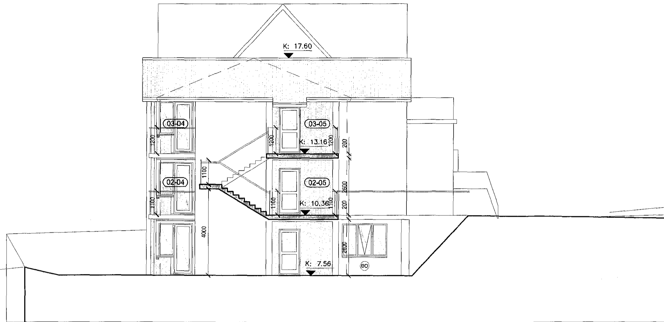
Sneiðing A-A mkv. 1:100

Samþykkt á fundi skipulags- og byggingarfulltrúa 18 OKT 2015 Bjarki Jóhannesson Skipulags- og byggingarfulltrúi