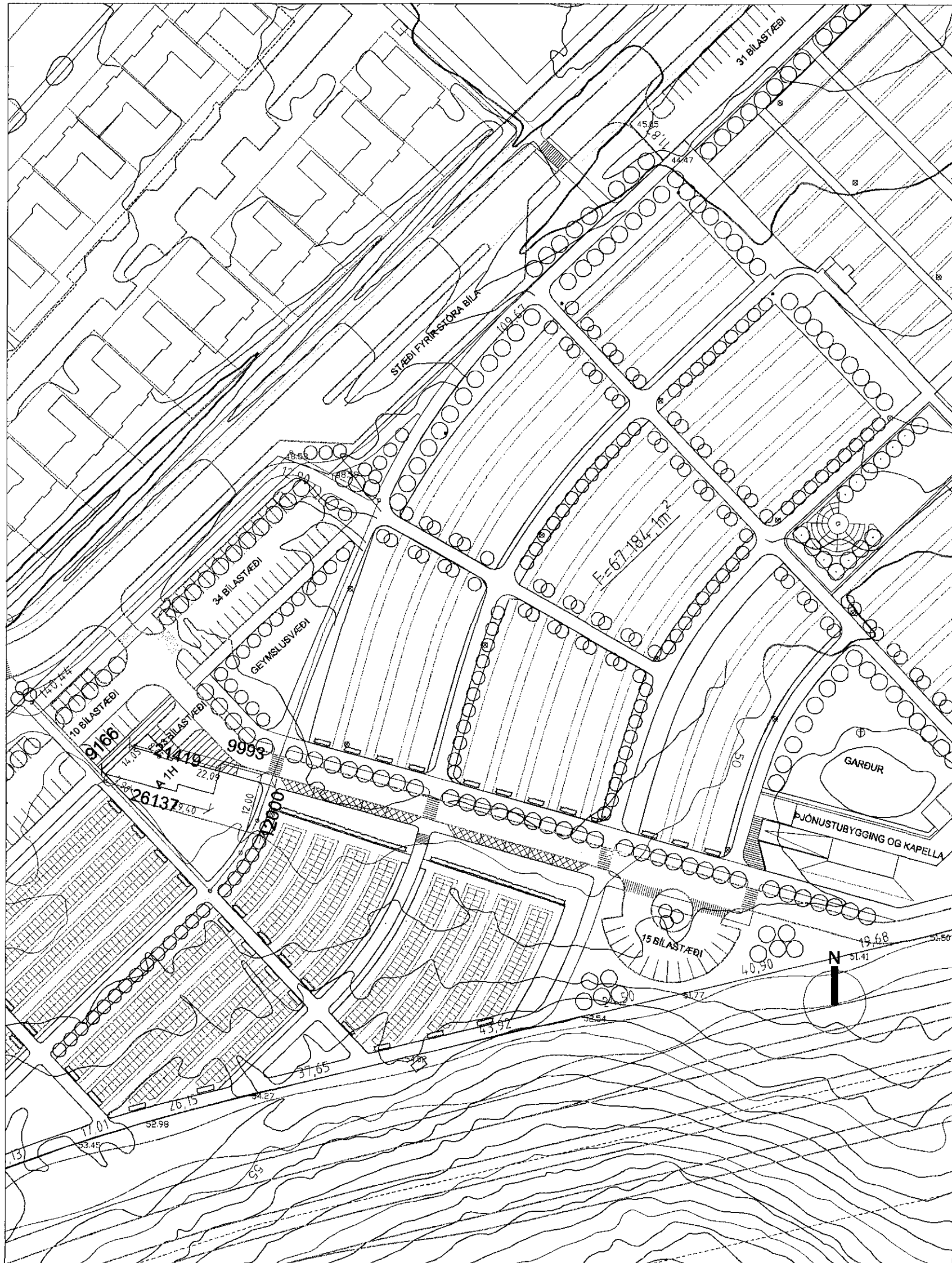
afstöðumynd í mkv. 1:1000

Öll mál eru í mm. Mælið ekkil á teikningum. Öll mál áthugast á staðnum. Ósamræmi í teikningum og vafaatriði skal tilkynna arkitektum strax.