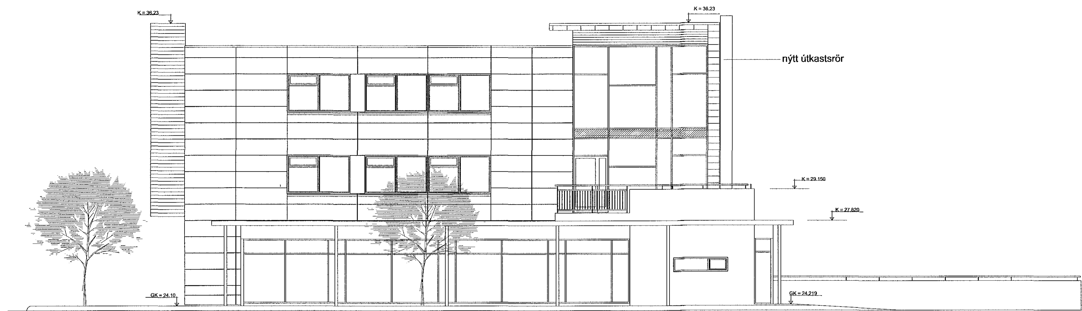
Ásýnd til suðurs

Samþykkt þann 18. maí 2016 Byggingafulltrúin í Hafnarfirði