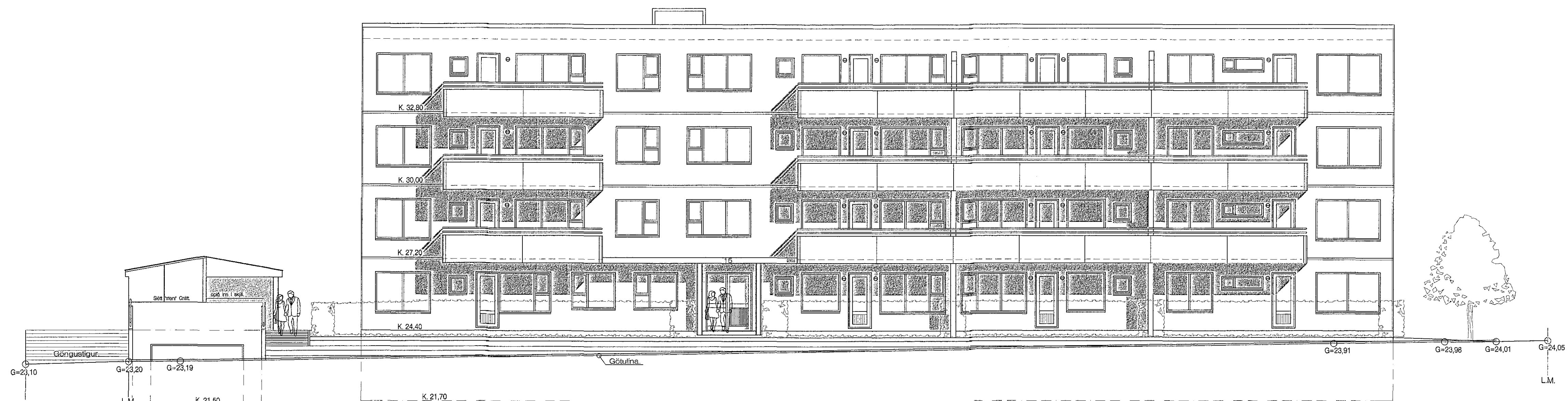
Vesturhlíð. 1 : 100