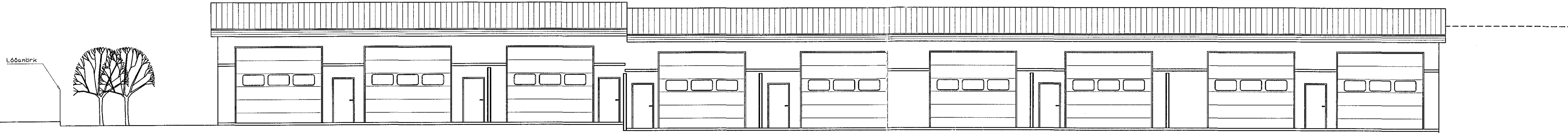
Útlit, Norður, 1:100