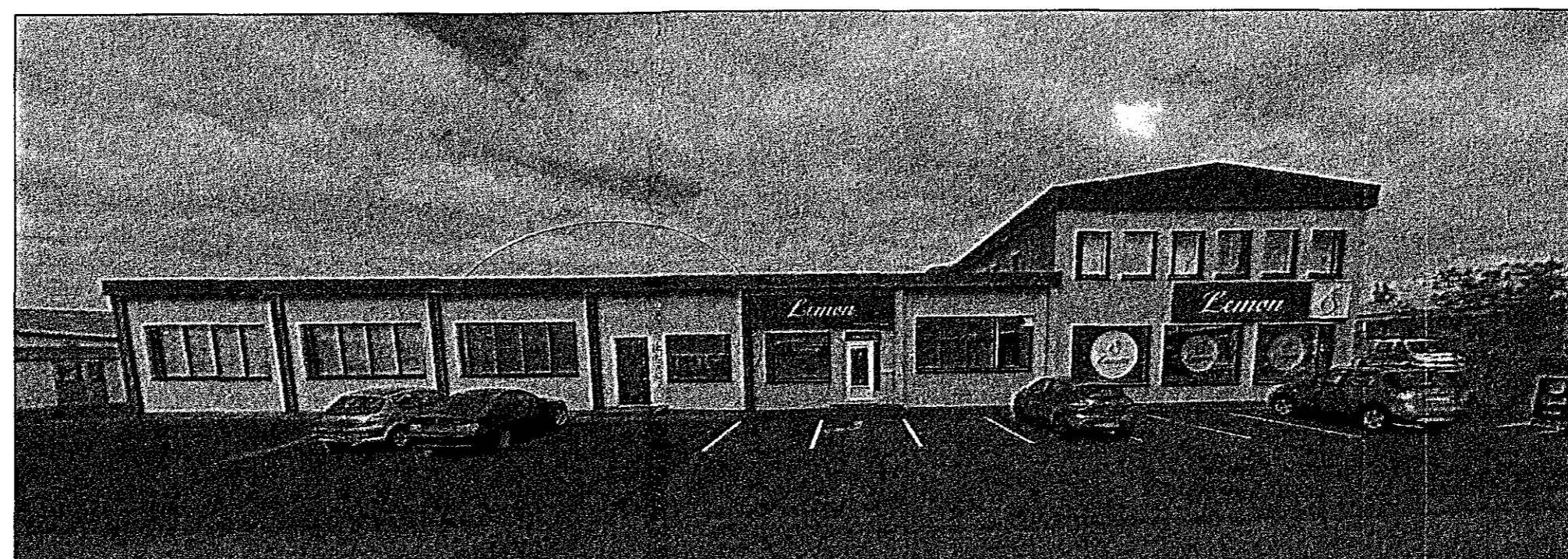
HJALLAHRAUN 11 - LJÓSMYND SÝNIR ÁSÝND OG AÐKOMU SUÐUR LANGHLIDAR