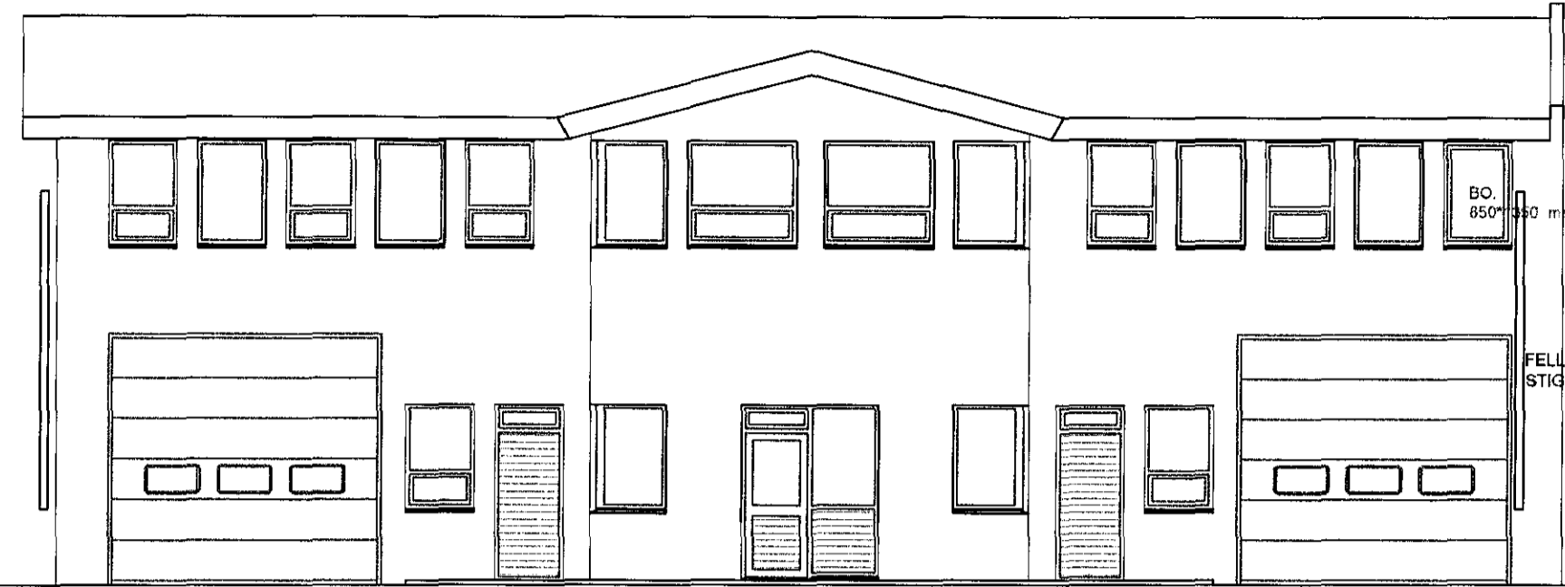
AUSTUR MKV. 1:100.