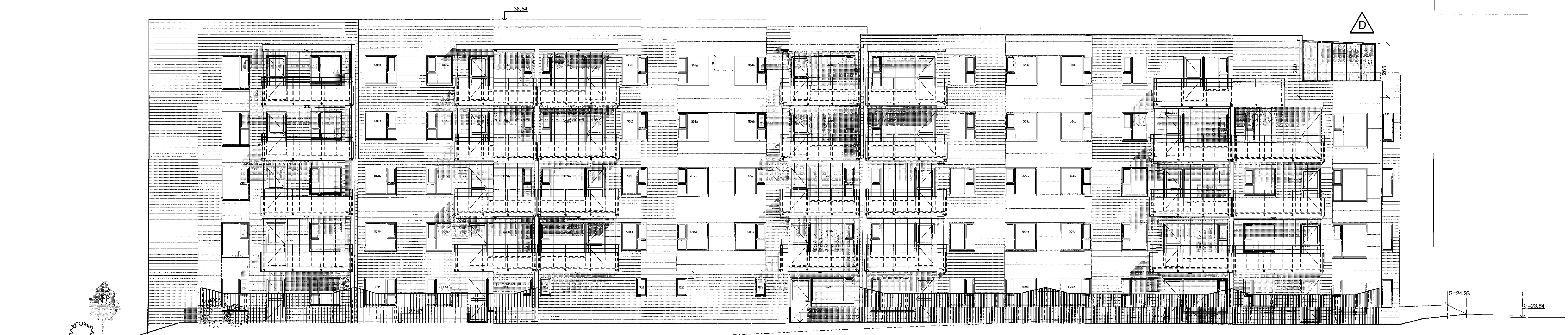
ÚTLIT 1:100 Suð-vesturhlíð

Samþykkt þann 05. apríl 2017 Byggingaáttættunin í Hafnarfirði