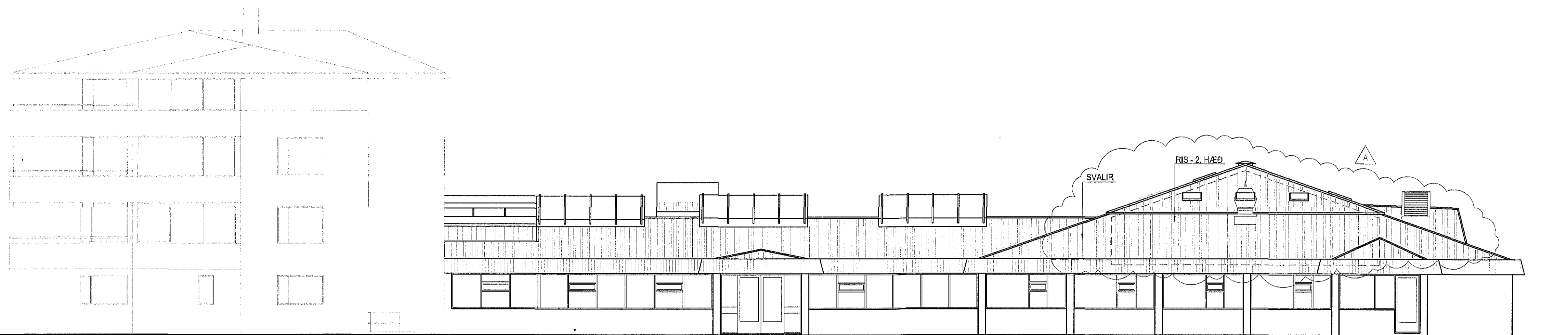
MHL 01 - HJÓKRUNARHEIMILIÐ SÓLVANGUR RÝMI EKKI LAGT FYRIR