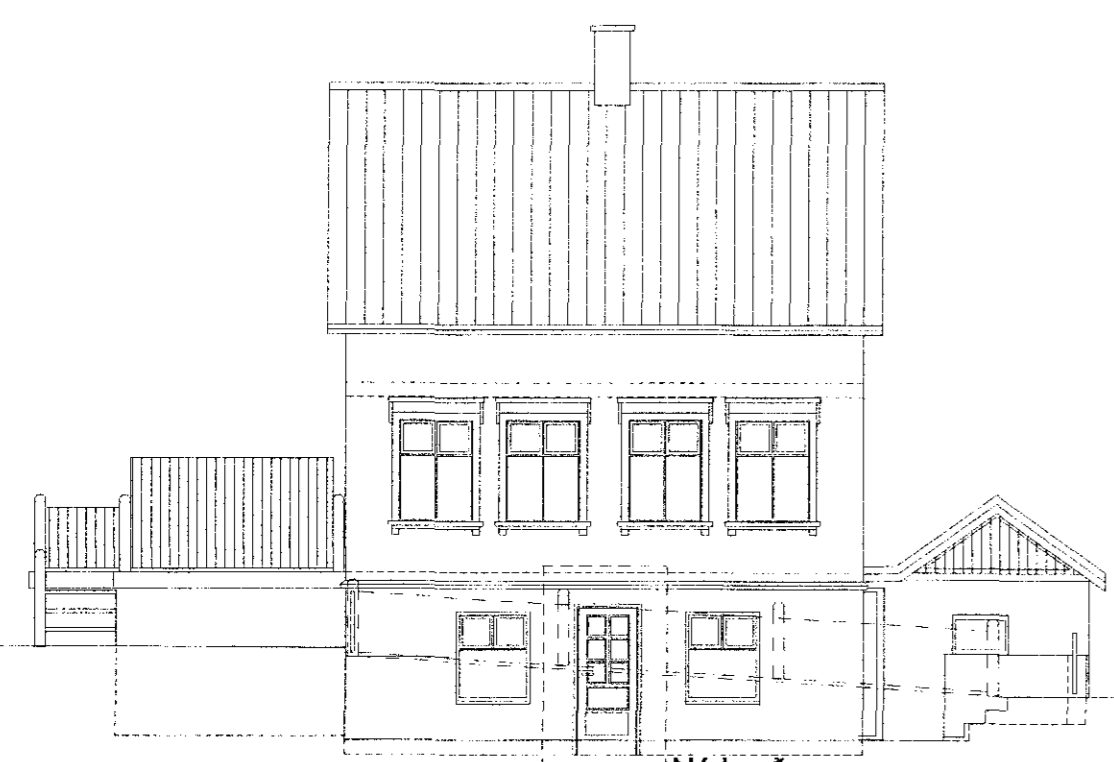
SUÐ-VESTUR Ny hurð

Samþykkt þ.m. 31. maí 2017 Byggingaáhlutránn í Hafnarfirði