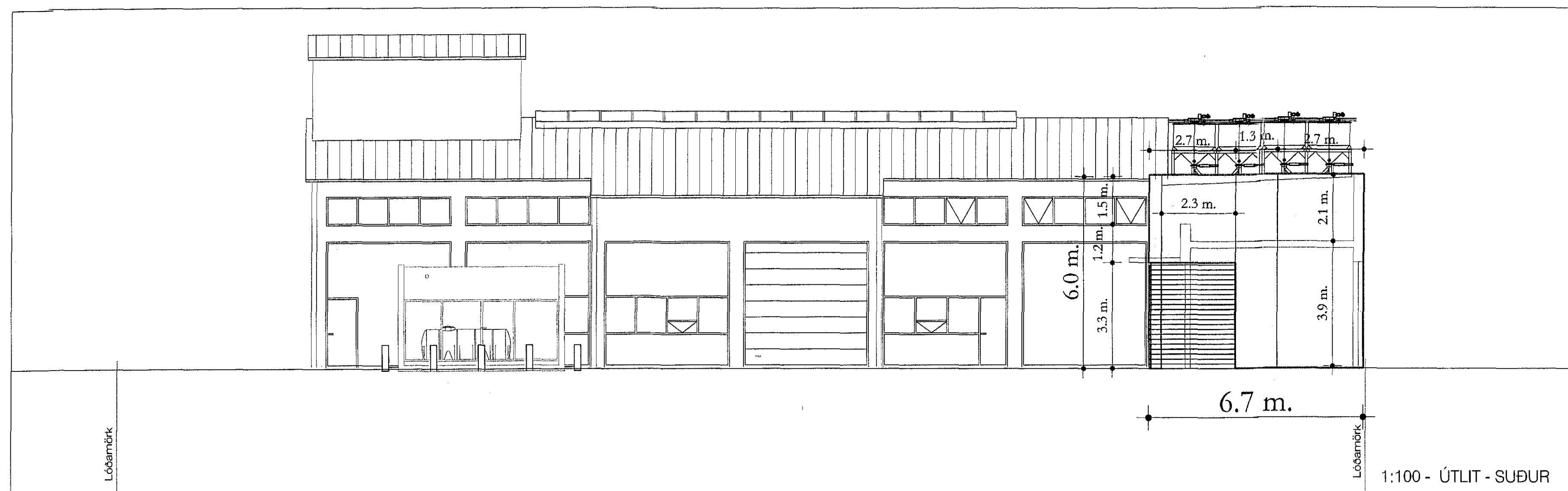
1:100 - ÚTLIT - SUÐUR