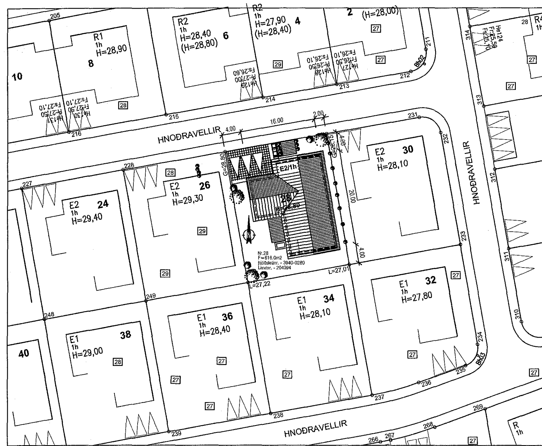
afstöðumynd - 1:500