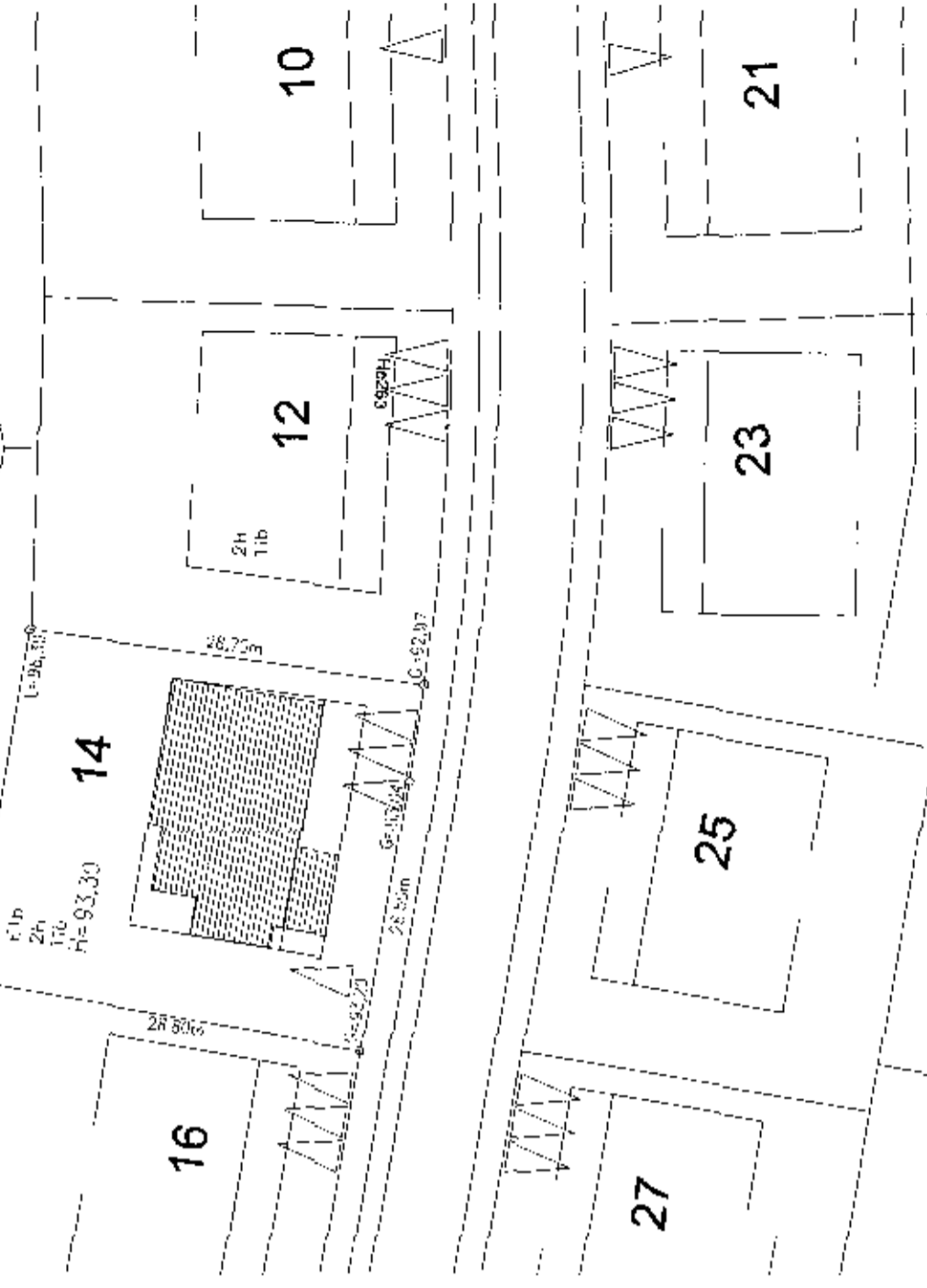
Afstöðumynd mkv. 1:500