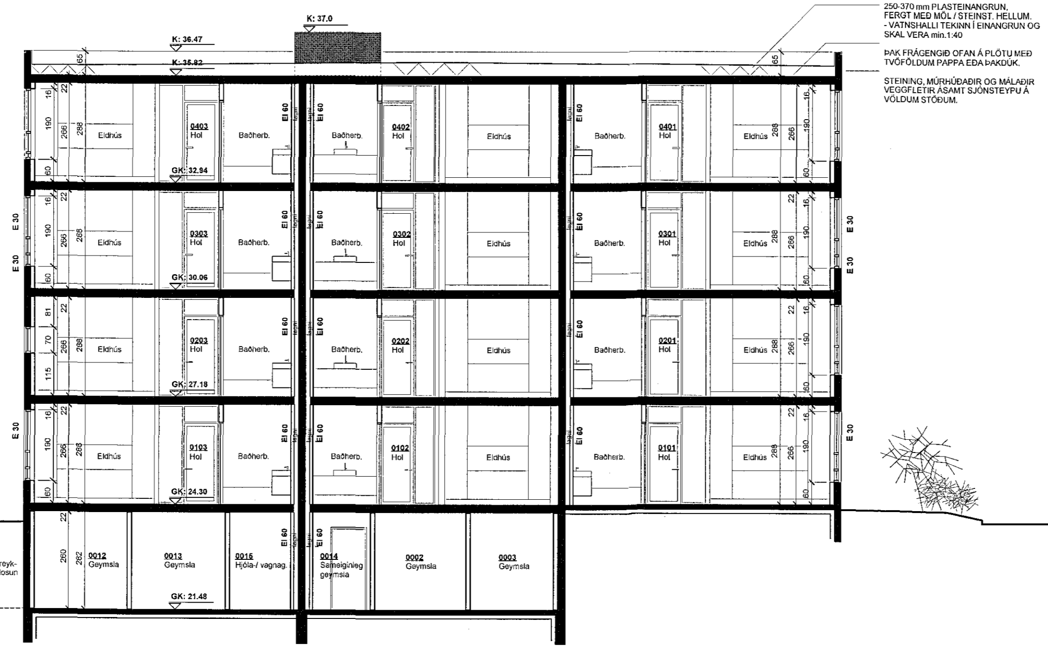
SNID B B

Samþykkt þann 14. feb. 2018 Byggingafulltrúinn í Kópavogi