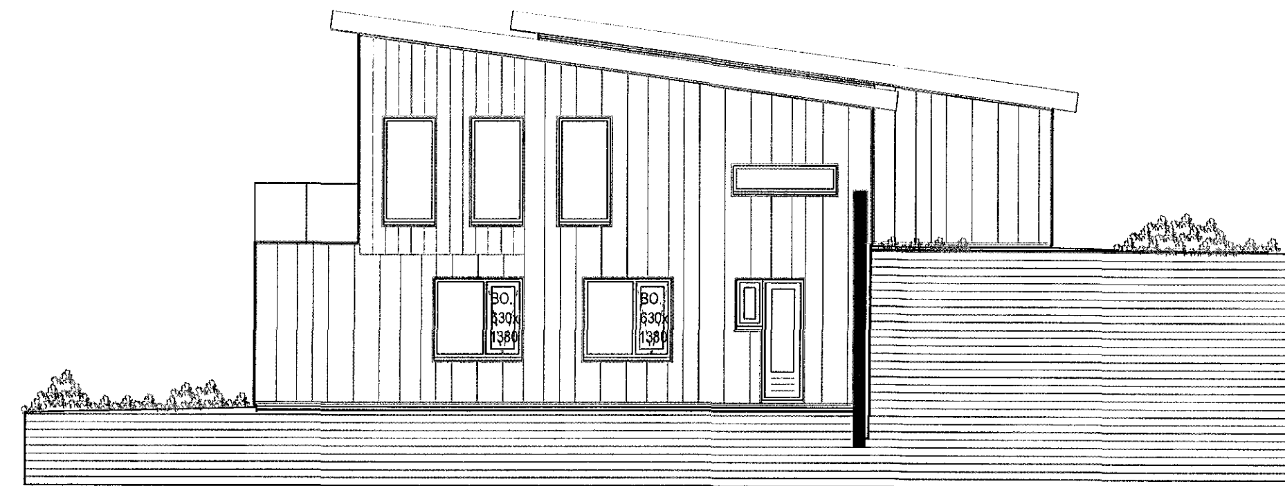
SNID D-D MKV. 1:100.