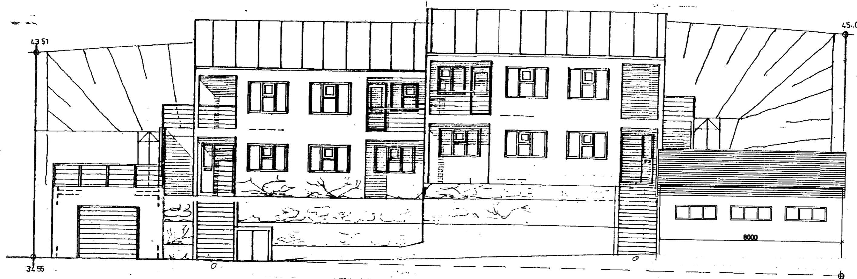
Útlit til suð-vesturs