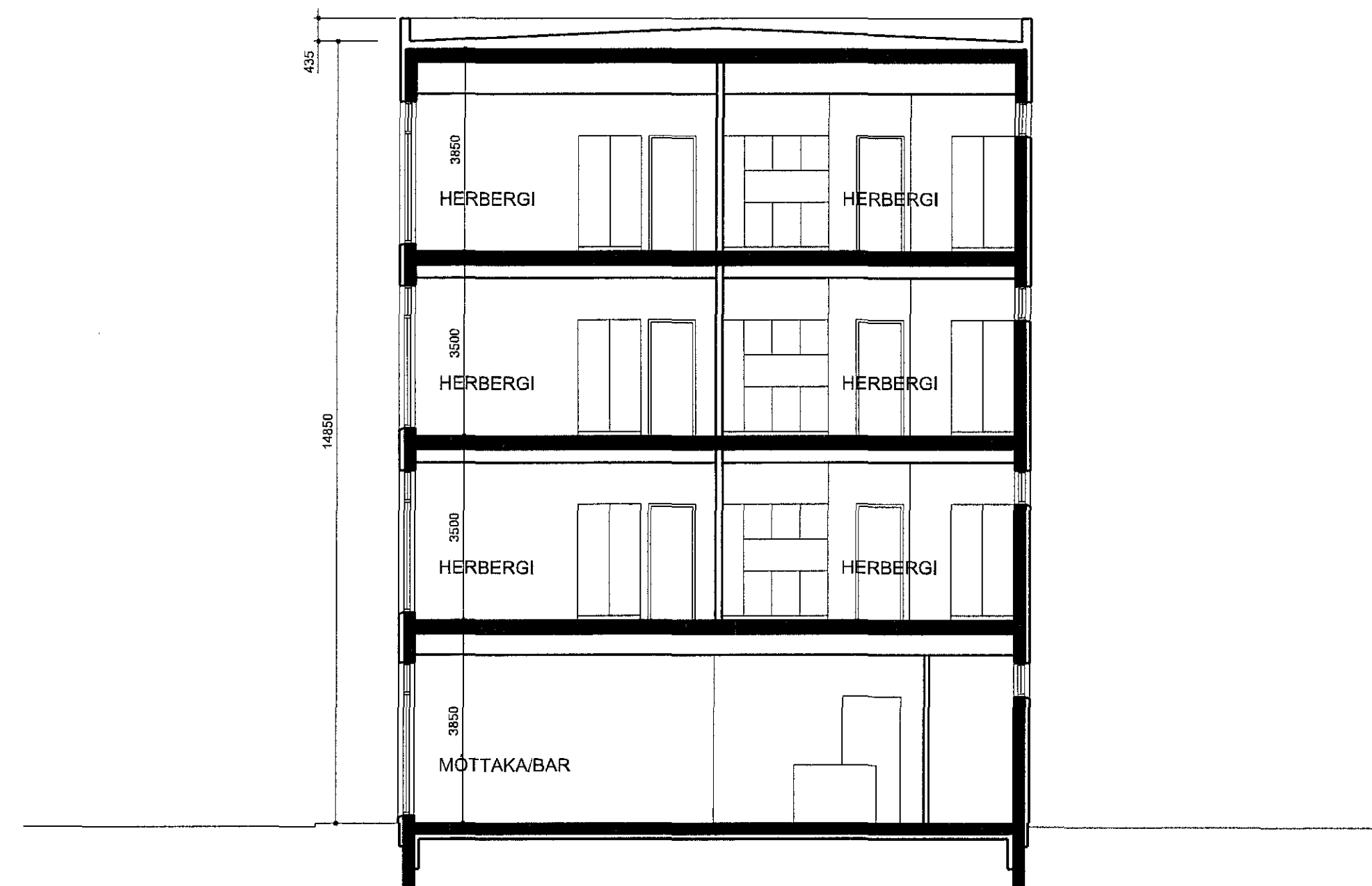
SKURÐMYND/ TURN, SÉÐ TIL NORÐURS