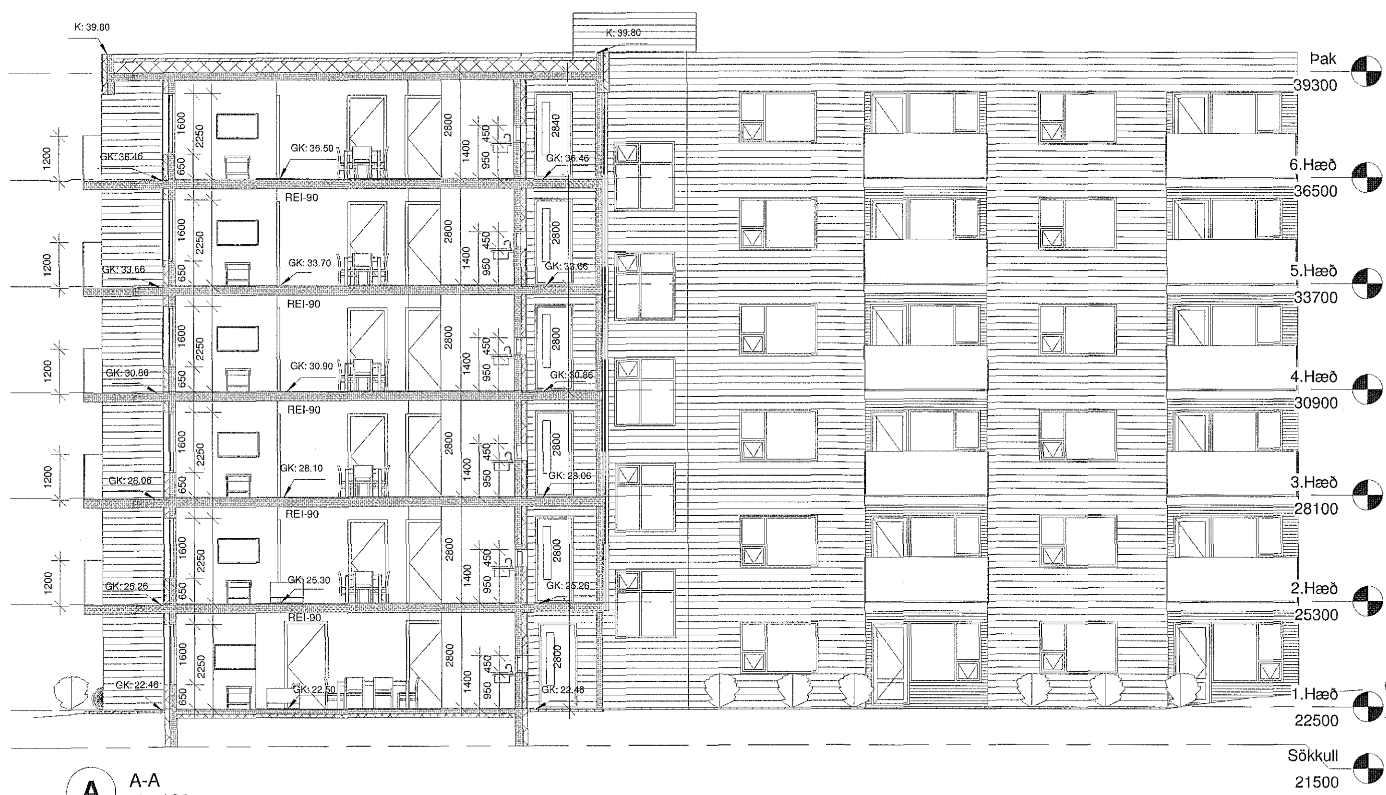
A A-A 1:100