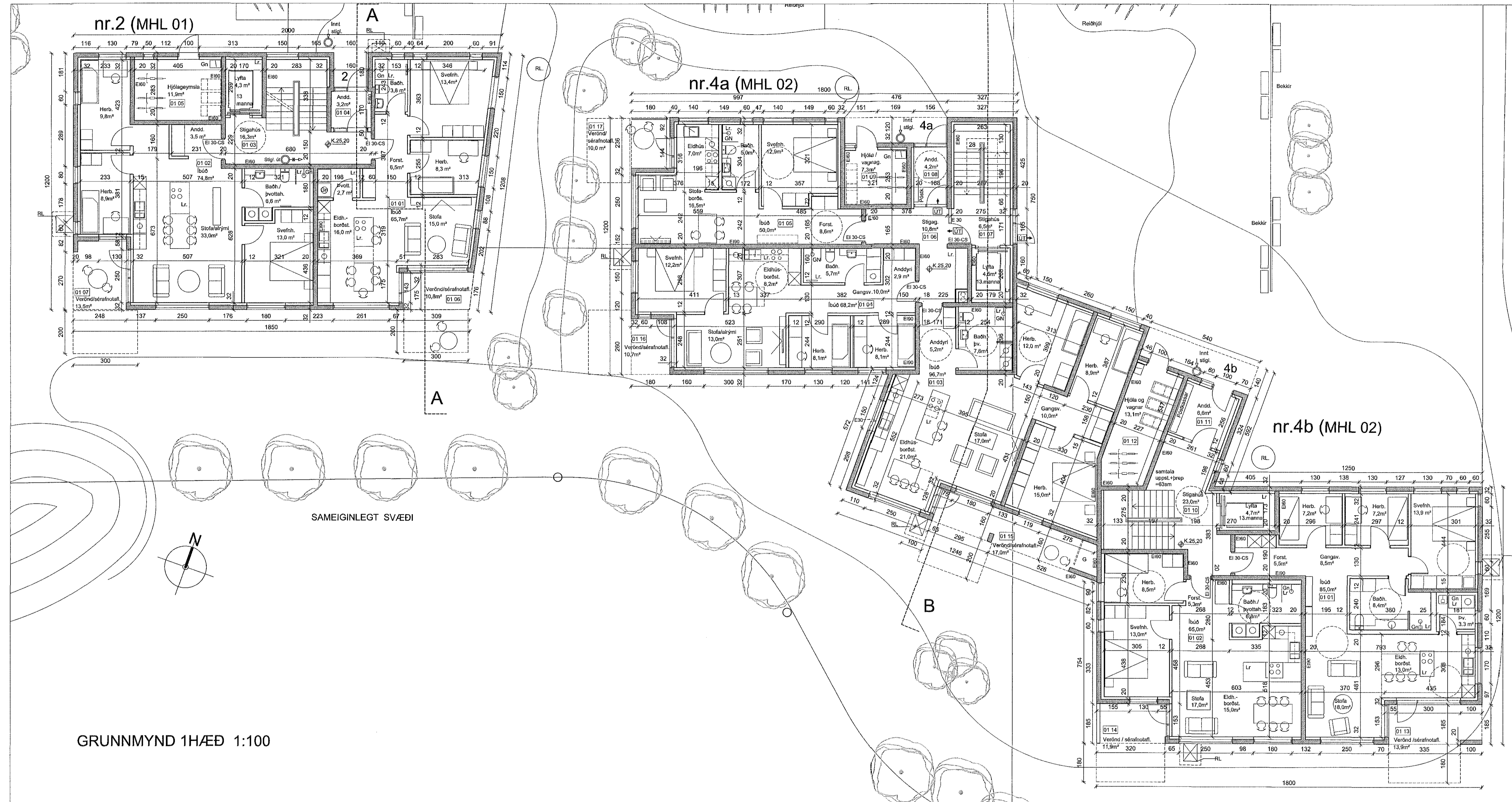
GRUNNMYND 1HÆÐ 1:100

Samykkt þann 15 ágú. 2018 Dyggjagálfurúnn í Hafnarfirði