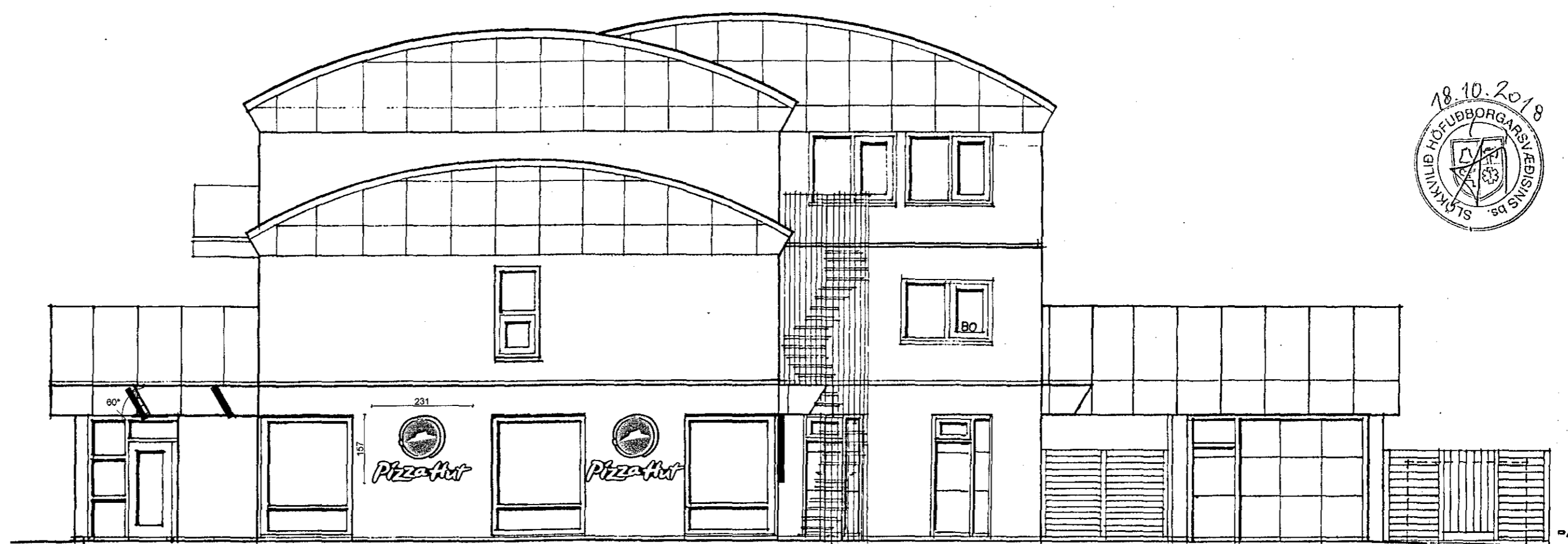
ÚTLIT SUÐUR PH-001