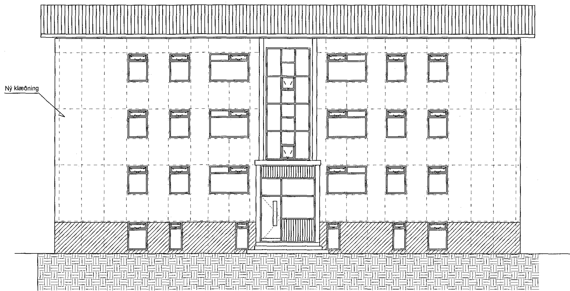
Útlit norð-austurhlíð 1:100